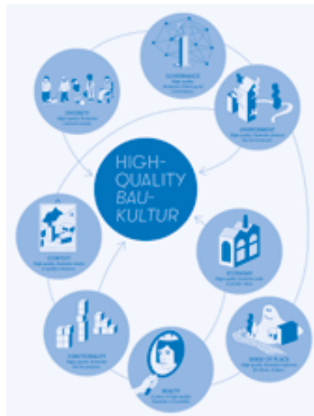
Quality criteria according to the Davos Baukultur Quality System, 2021

Baukultur embraces every human activity that changes the built environment. The whole built environment, including every designed and built asset that is embedded in and relates to the natural environment, is to be understood as a single entity. Baukultur encompasses existing