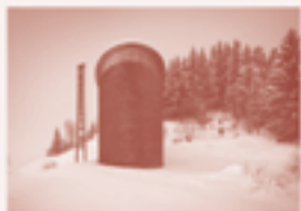
17 — Caplutta, Sogn Benedetg