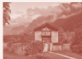
16 — Haus Vogelbacher, Stamp