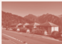
19 — Scuola elementare della Valle Celerina, Castineda