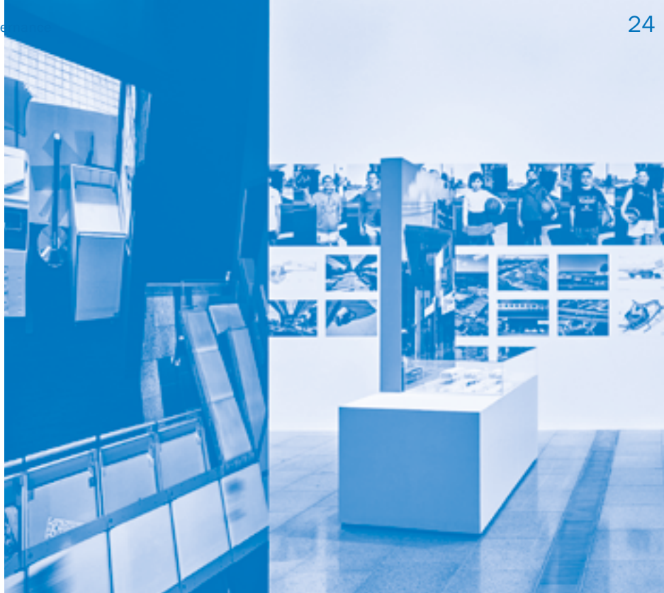
Simulaa, Design Standards (2022) in the foreground of the Civic Architecture display, in the exhibition 'Melbourne Now' at The Ian Potter Centre, National Gallery of Victoria, Melbourne, 2023