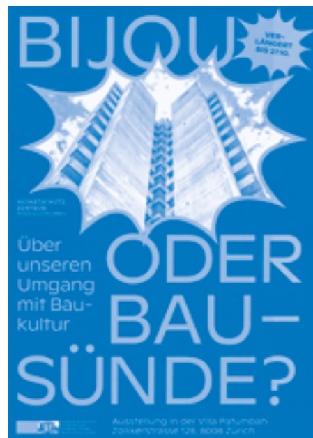
'Bijou oder Bausünde. Über unseren Umgang mit Baukultur' (2022-2024): exhibition flyer with Triemli Tower in Zurich