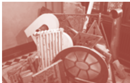
'Bijou oder Bausünde': presentatie die bouwafval problematiseert

Tegenwoordig is de brutalistische betonarchitectuur opnieuw onderwerp van discussie, maar nu als jong erfgoed, en de kwestie is er niet zozeer een van architectuurhistorisch belang en gaat niet over de juiste criteria voor erfgoedstatus, maar over schoonheid en de politieke betekenis van een generatie woongebouwen en welzijnsinstellingen. Van september 2022 tot mei