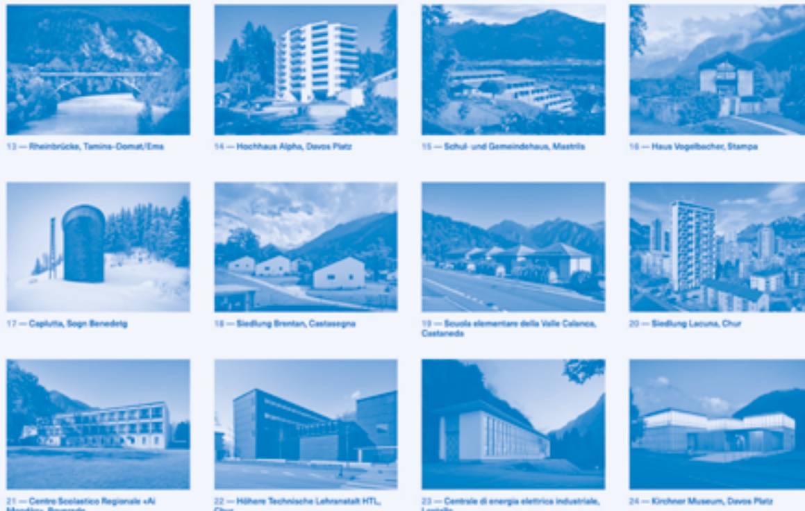
52 Beste Bauten: Baukultur Graubünden 1950-2000, 2020, including the Kirchner Museum in Davos

but made across a longer time period. These ubiquitous objects are a material reality of the cityscape that is often overlooked as resulting from both design and governance, but one that can nonetheless qualitatively affect our experience of the built environment, and our conception of design quality itself. Based on the research work of architecture practice Simulaa, the models of streetlights, benches, rubbish bins and bike racks were rendered in a uniform white resin. Seeing them in an intimate array highlights the diversity of design outcomes in what we might expect to be standard objects, but also their associations with making the public realm welcoming and comfortable. It is an apt illustration of the gambit of contemporary design governance: that good design can be an expression of social and civic values, as it also aims to tangibly improve the quality of individual lives.