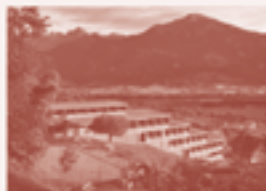
15 — Schul- und Gemeindehaus, Mairhof