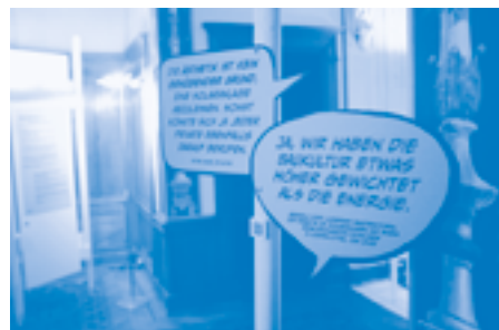
'Bijou oder Bausünde'. Speech bubbles with quotes about Baukultur and aesthetics

exchange on design review practices that was already underway. 18 In the book that followed this conference, Brenda Case Scheer astutely identified the intersecting challenges of design review to negotiate power, freedom, justice and aesthetics. 19 These terms continue to be at stake in design governance, if not explicit agendas of design review panels.