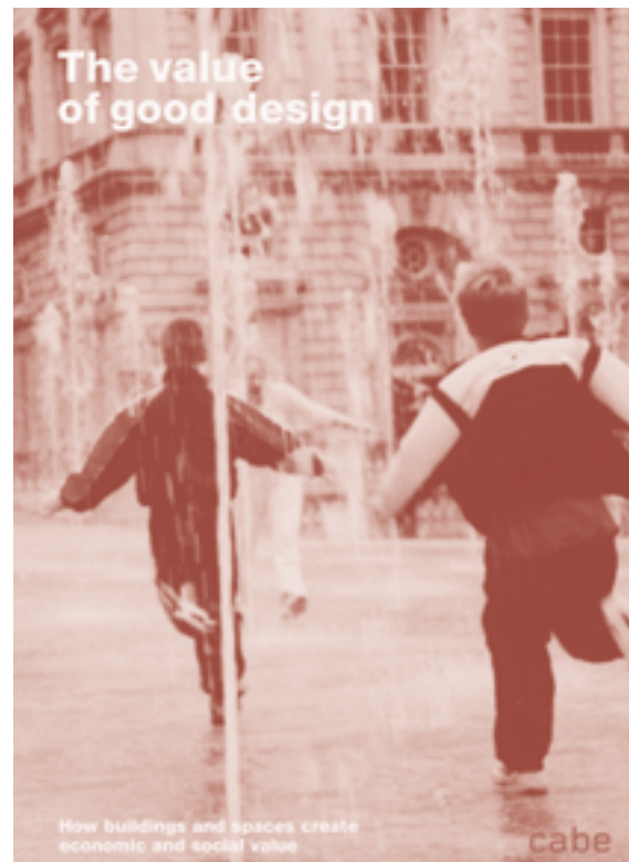
CABE vervaardigde talrijke publicaties en hulpmiddelen om de kwaliteit van de gebouwde omgeving te verbeteren, zoals The Value of Good Design (2002) en Design Review: Principles and Practice (2013, 2019)

discipline en de verheffing van het concept 'goed ontwerp' boven de esthetische categorie 'schoonheid'.