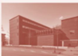
22 — Höhere Technische Lehranstalt HTL, Chur