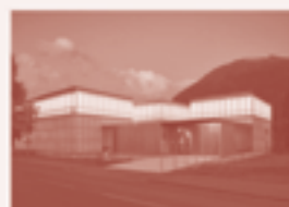
24 — Kirchner Museum, Davos Platz

52 Beste Bauten: Baukultur Graubünden 1950-2000, 2020, waaronder het Kirchner Museum in Davos