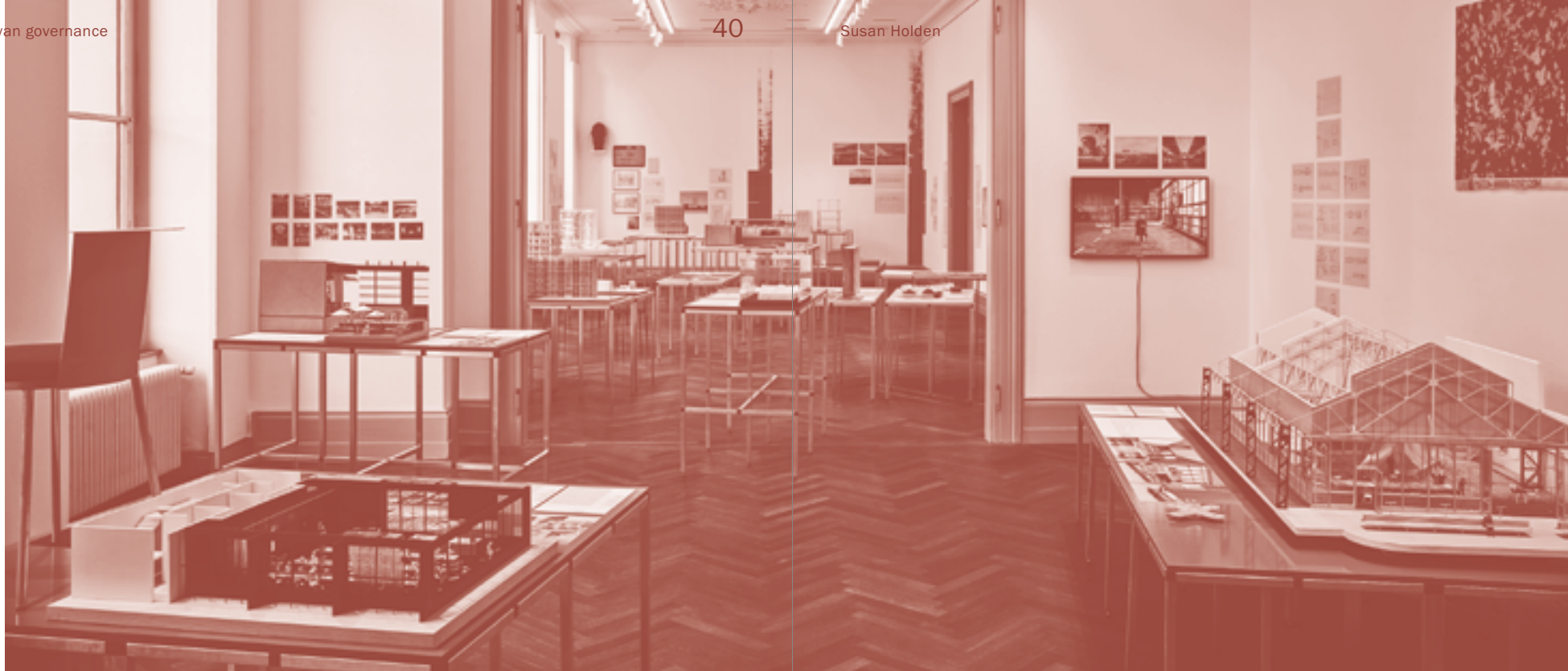
'Soft Power: The Brussels Way of Making the City' in S AM Swiss Architecture Museum, Bazel

ontwikkelt. 13 De 16 hoofdstukken gaan over kennisgebieden als architectuurgeschiedenis, bouwtechniek, sociologie, projectontwikkeling, monumentenzorg, verkeer en landschap. In de inleiding wordt opgemerkt dat de uitdaging niet ligt in het simpelweg overbrengen van bundels disciplinaire kennis, maar eerder in het – in de 'integratieve en verbindende' geest van de bouwcultuur – openstellen van disciplines ten behoeve van uitwisseling. 14