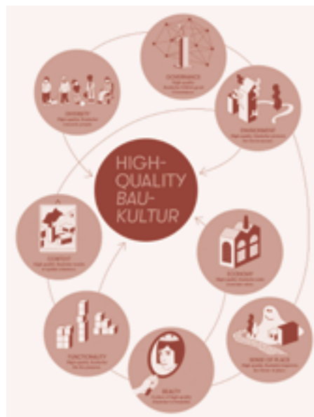
Kwaliteitscriteria volgens het Davos Baukultur Quality System, 2021