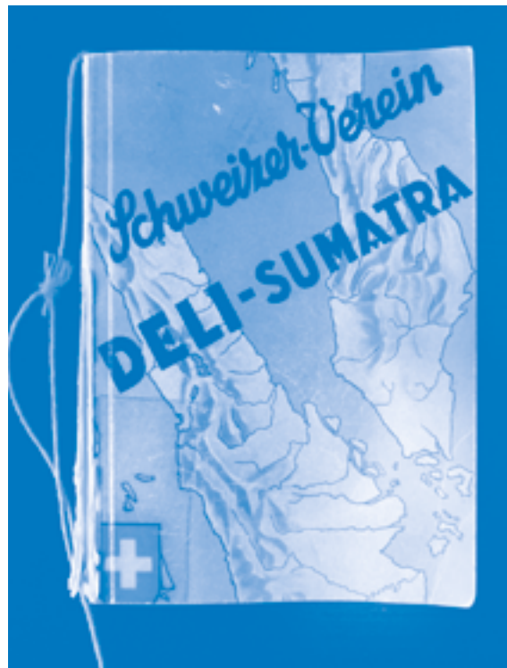
'Patumbah is a place in Sumatra', cabinet exhibition. Floor map and displayed book Schweizer Verein Deli-Sumatra (Zurich, 1936)

refers to the place Patumbak, turning the villa into more than mere 'transactional architecture': a stirring cultural testimony to European extractive colonialism and its propagandist monumentalisation. 21 The Villa is a continuing reminder – provided that a critical reading is sufficiently developed through, for example, an exhibition such as that in the sous-sol – not to cut loose building culture from wider politico-ecological perspectives and concerns. 22