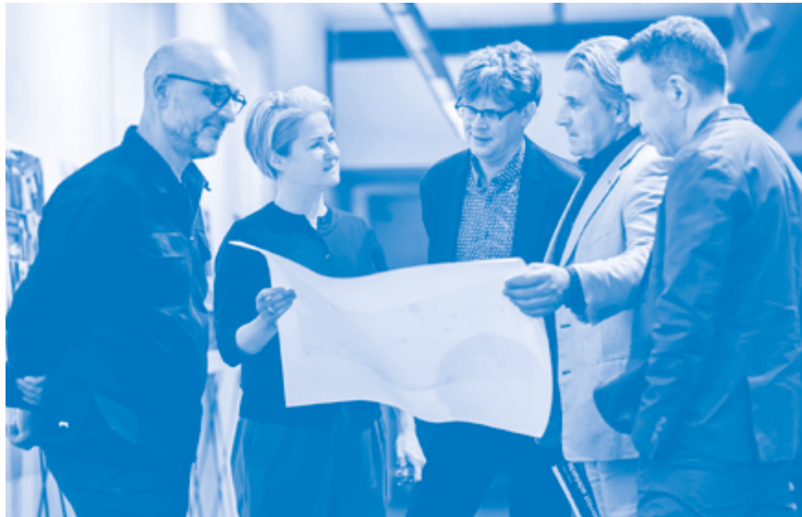
The South Australian State Design Review Panel Chairs with the Government Architect, Kirsteen Mackay

to architecture as a cultural practice – rather than merely as a technical discipline or utilitarian concern. On the other hand, the urgent emphasis on sustainability and ecological issues has placed this cultural perspective on the defensive, or at least prompted its redefinition. Yet, the cultural foundations of architectural quality cannot be affirmed only in contrast to technical, economic, or energy-performance metrics. Equally important is the question: what architectural or building culture do we presume, and which one do we wish to foster?