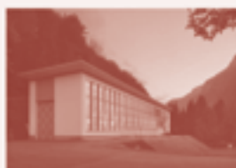
23 — Centrale di energia elettrica industriale, Leontino