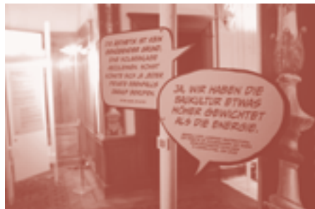
'Bijou oder Bausünde'. Tekstballonnen met citaten over Baukultur en esthetiek

recht op vrijheid van meningsuiting. 17 De International Conference on Design Review, die in 1992 in Cincinnati werd gehouden, bracht deelnemers uit de Verenigde Staten, Groot-Brittannië, Duitsland, Zuid-Afrika, Brazilië en Australië bij elkaar om de al in gang gezette internationale kennisuitwisseling over manieren van ontwerpbeoordeling verder te stimuleren. 18 In het boek dat na de conferentie werd gepubliceerd, benoemde Brenda Case Scheer op scherpzinnige wijze de uitdagingen waarmee een ontwerpbeoordeling te maken krijgt tijdens het onderhandelen over macht, vrijheid, rechtvaardigheid en esthetiek. 19 Deze spelen nog steeds een rol in het ontwerpend besturen, als ze niet al de expliciete agenda van die ontwerpbeoordelingscommissies uitmaken.