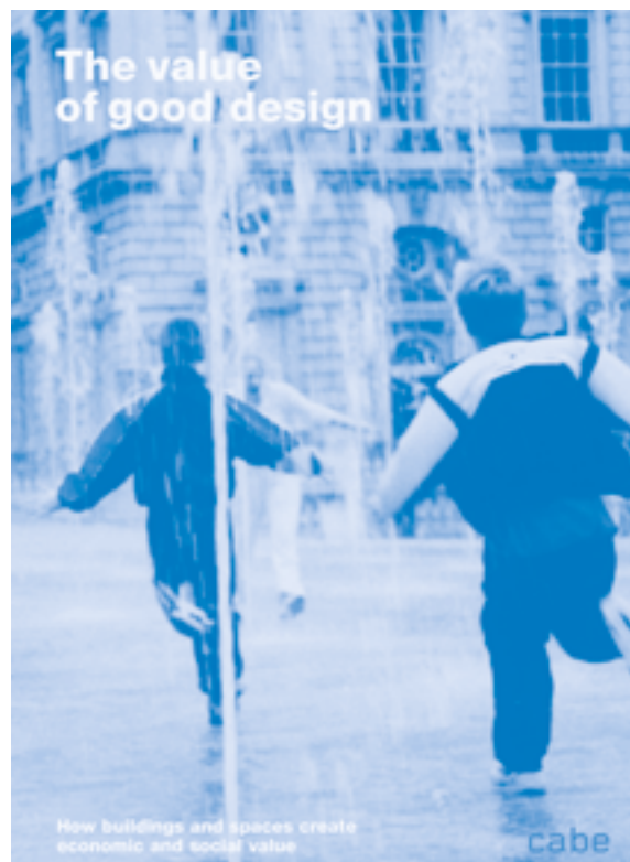
CABI produced numerous publications and resources to support the improvement of built environment design quality including The Value of Good Design (2002) and Design Review: Principles and Practice (2013, 2019)

explain the role of design review panels in promoting good design. It's guidance documents provided criteria for what made a good project with reference to Vitruvius's triumvirate of commodity, firmness and delight, but also highlighted the role of design review processes in prioritising design quality over conformity or compliance with planning regulation. 22 It stated that: 'Design is a creative activity, and definitions of quality in design are elusive. It cannot be reduced to codes and prescriptions. . . . the best examples often break or transcend the rules.' 23