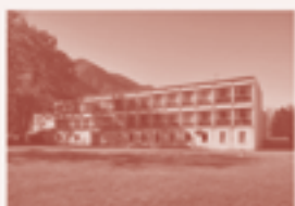
21 — Centro Scolastico Regionale «Al Mendrisio», Remedio