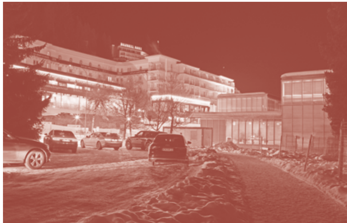
Davos, met het Grandhotel Belvédère en het Kirchner Museum tijdens het World Economic Forum

brede (toenmalige) Zwitserse condities die de productie ervan mogelijk maakten, met name op drie punten. Het gaat daarbij om aspecten van de Zwitserse cultuur zoals een protestants werk- en kapitaalethos, een sterke democratische organisatie met grote gemeentelijke autonomie, of het territoriale zelfbeeld van dorpen in berglandschappen versus geconcentreerde steden en hightech infrastructuur. Daarnaast op aspecten als een achtergrond van (internationale) theorievorming die, grotendeels vanuit de dominante ETH Zürich, het ideaal van een architecturale autonomie cultiveerde. En tenslotte om een beroeps cultuur waarin architecten zeer nauw betrokken waren bij het bouwen, met het strak gereguleerde Zwitserse competitiesysteem dat destijds ook kansen kon bieden aan jonge architecten zoals Gigon/Guyer, en met hoge productiewaarden in de bouw. 25 Bij elk van deze generalisaties plaatst Davidovici niettemin ook kanttekeningen, zoals wanneer ze de specifieke kenmerken van de bouw cultuur in het kanton Graubünden uitlicht. 26