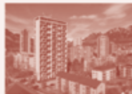
20 — Siedlung Leuna, Chur