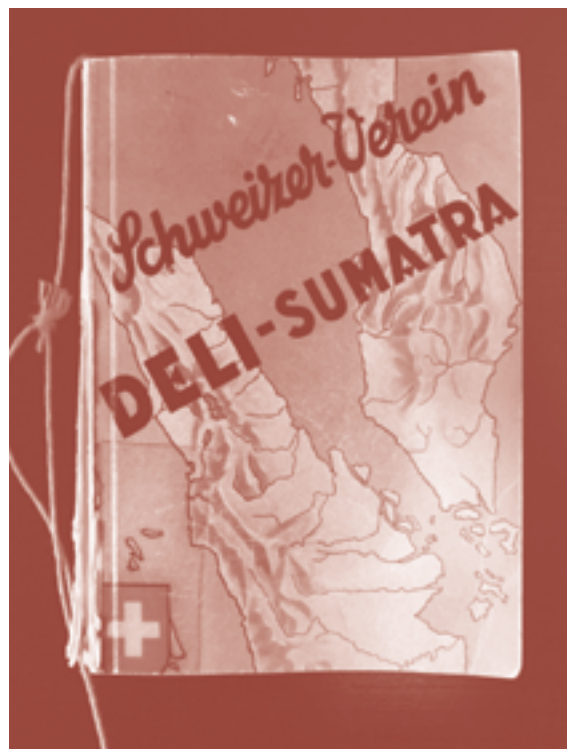
'Patumbah ligt op Sumatra', een kabinetten-tentoonstelling in Villa Patumbah, 2020. Vloerkaart en tentoongesteld boek Schweizer Verein Deli-Sumatra (Zürich, 1936)

gesitueerd wordt als koloniaal erfgoed. 20 Deze tentoonstelling houdt zich niet bezig met de gecombineerde architectuur van deze Italiaanse neorenaissancevilla met aspecten van een Chinese binnenhofwoning, of met de exotiserende ornamenten – van draakvormige waterspuwers die uit de klassieke gevels steken tot (echte en valse) Chinese inscripties in de interieurs van de tweede verdieping. De tentoonstelling documenteert in plaats daarvan de koloniale realiteit van de Sumatraanse plantages die het kapitaal genereerden dat deze villa mogelijk maakte. De bouwer, Carl Fürchtegott Grob, was een Zwitser die fortuin had gemaakt in de plantage-economie van Nederlands-Indië. Tussen 1871 en 1889 dreef hij samen met een Beierse zakenpartner een van de grootste tabaksplantages aan de noordoostkust van Sumatra. Hij hanteerde het koloniale systeem waarbij contractarbeiders van onder andere Java en uit China werden uitgebuit, en het landgebruik en de sociale organisatie van de lokale Batak en Maleiers werden vervangen. Eenmaal terug in Zürich liet Grob de somptueuze villa met koetshuis bouwen en de landschapstuin aanleggen. Een vergulde inscriptie verwijst naar de plaats Patumbak, waardoor de villa meer wordt dan louter 'transactiearchitectuur', maar een roerende culturele