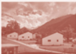
18 — Siedlung Brentan, Castasegna