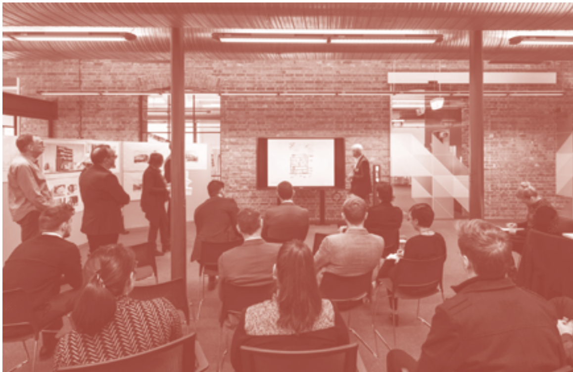
Het South Australian State Design Review Panel in actie

na de teloorgang van de verzorgingsstaat en natievormende beleidskaders, ook ruimte maken voor een gesitueerde kritiek op de maatschappelijke en ecologische effecten van het neoliberalisme?