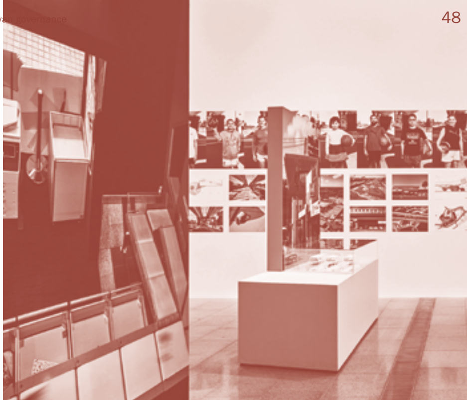
Simulaa, Design Standards (2022) op de voorgrond van de sectie Civic Architecture, in de tentoonstelling 'Melbourne Now' in het Ian Potter Centre, National Gallery of Victoria, Melbourne, 2023