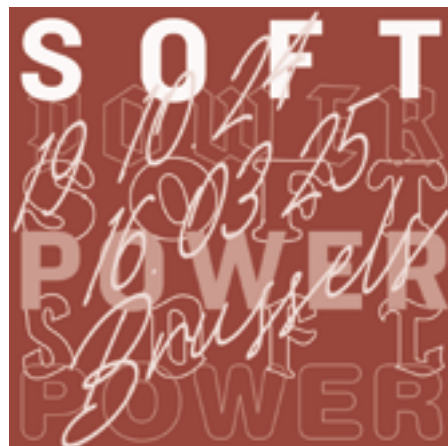
'Soft Power: The Brussels Way of Making the City' toonde het werk van de Brusselse Bouwmeester/Maitre Architecte in S AM Swiss Architecture Museum, Bazel. Campagnebeeld, 2024