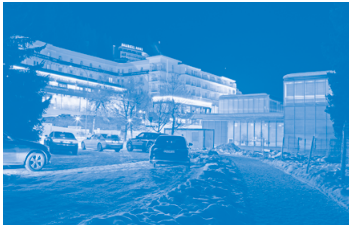
Davos, with Grandhotel Belvédère and Kirchner Museum during World Economic Forum

management began to take hold in Switzerland too, prompted by a globalising construction economy: