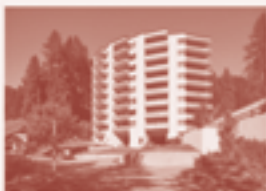
14 — Hochhaus Alpha, Davos Platz