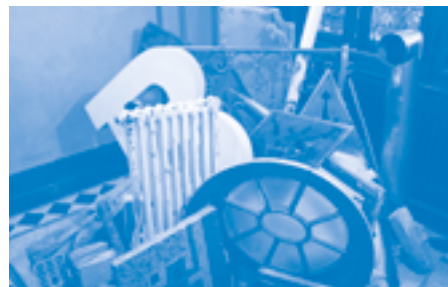
'Bijou oder Bausünde'. Display problematising waste

Today, brutalist concrete architecture is once again contested, but now as young heritage. The issue is not so much one of architectural-historical importance, or the appropriate criteria for heritage status, but beauty and the political significance of a generation of residential buildings and welfare facilities. From September 2022 until May 2024, the exhibition 'Bijou oder Bausünde? Über unseren Umgang mit Baukultur' (Jewel or building sin? About our dealings with building culture) was on view in Villa Patumbah, and not coincidentally, its poster featured Zurich's brutalist Triemli Tower (1966). The apartment building, designed by Esther and Rudolf Guyer, was chosen as Switzerland's ugliest building as recently as 2018 by readers of the free newspaper 20 Minuten . Others defended the brutalist building legacy as testimony to 'social ambition, creativity and courageous optimism in the postwar period'. 17 It is one of the examples in the exhibition that pushes beyond philosophical consideration of architecture as a matter of culture and asks citizens to take a position