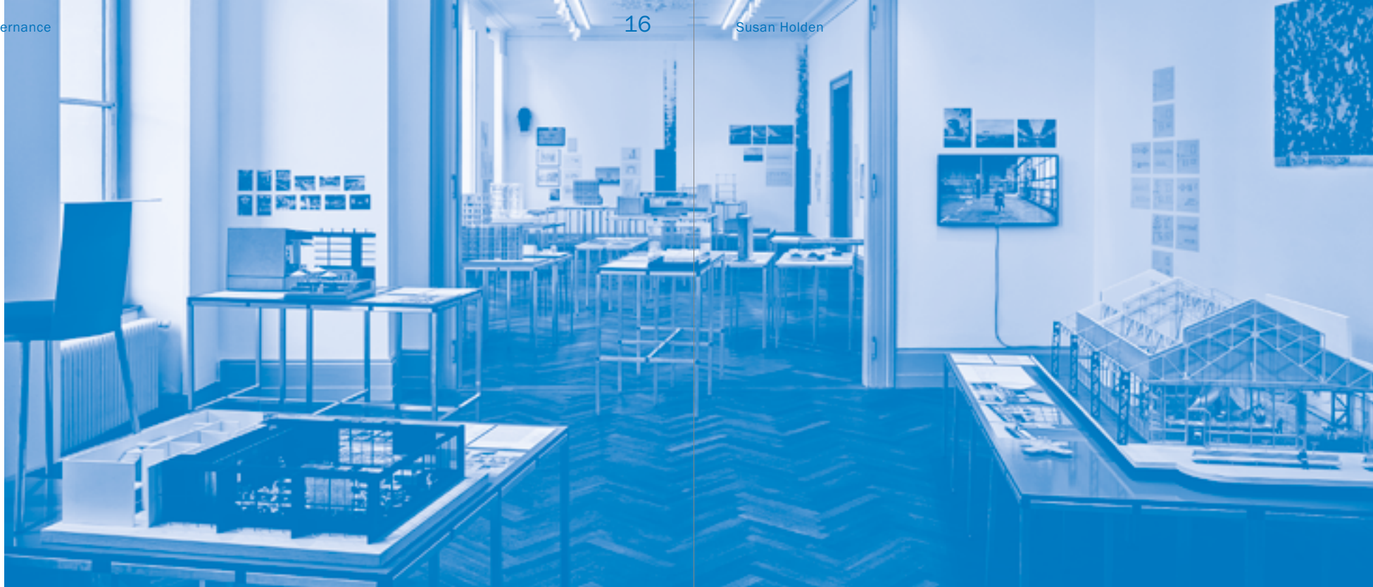
'Soft Power: The Brussels Way of Making the City' in S AM Swiss Architecture Museum, Basel

young people, including developing learning materials for schools. 13 The 16 chapters cover such knowledge domains, from the history of architecture and building technique to sociology, project development, historic preservation, traffic and landscape. The challenge is not to transmit fixed packages of disciplinary knowledge, but to foster cross-disciplinary dialogue in the 'integrative and connective' spirit of building culture. 14