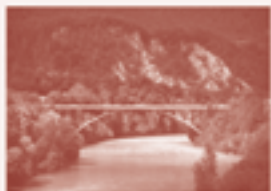
13 — Rheinbrücke, Tamina-Domat/Ems

32 'Melbourne Now' liep van 24 maart tot 20 augustus 2023. National Gallery of Victoria, 'Civic Architecture', ngv.vic.gov.au/melbourne-now/projects/civic-architecture (geraadpleegd 20 januari 2025).