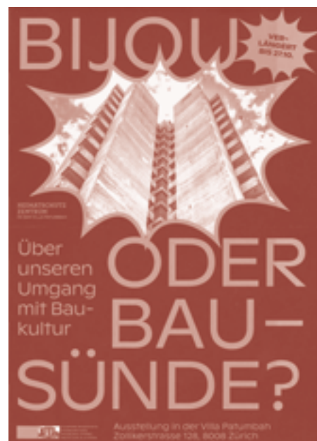
'Bijou oder Bausünde. Über unseren Umgang mit Baukultur ' (2022-2024): tentoonstellingsflyer met de Triemlitoren in Zürich