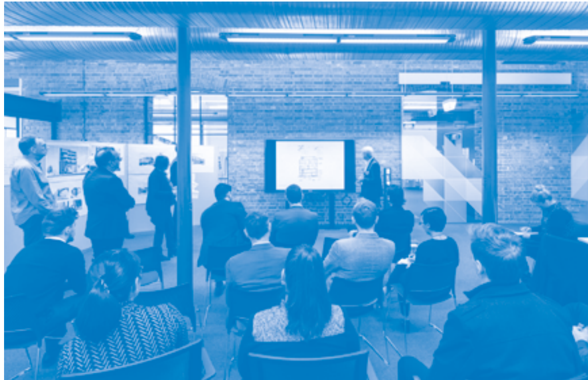
The South Australian State Design Review Panel in action. Office of Design and Architecture SA, Government of South Australia. CC BY 3.0 AU

but made across a longer time period. These ubiquitous objects are a material reality of the cityscape that is often overlooked as resulting from both design and governance, but one that can nonetheless qualitatively affect our experience of the built environment, and our conception of design quality itself. Based on the research work of architecture practice Simulaa, the models of streetlights, benches, rubbish bins and bike racks were rendered in a uniform white resin. Seeing them in an intimate array highlights the diversity of design outcomes in what we might expect to be standard objects, but also their associations with making the public realm welcoming and comfortable. It is an apt illustration of the gambit of contemporary design governance: that good design can be an expression of social and civic values, as it also aims to tangibly improve the quality of individual lives.