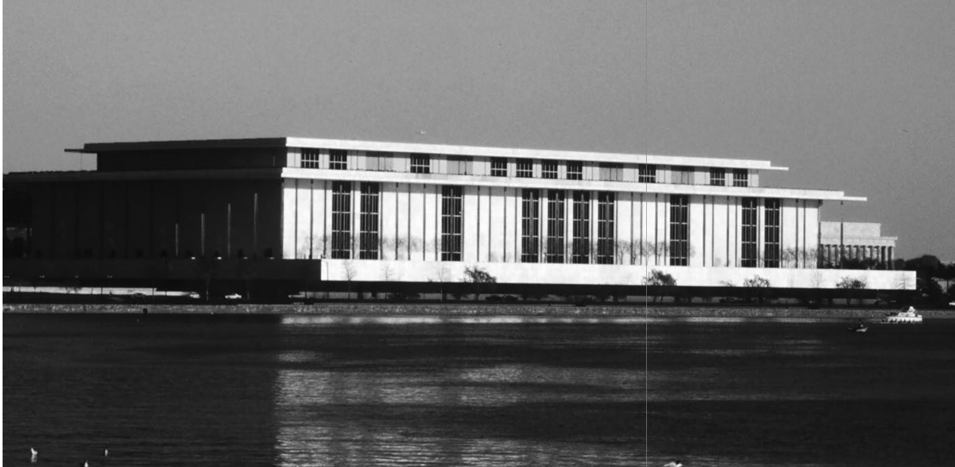
Edward Durell Stone, John F. Kennedy Center for the Performing Arts, Washington, DC, 1971

begin van zijn stuk beschrijft Pevsner een cartoon van Alan Dunn, gepubliceerd in The New Yorker van 15 juni 1968. Twee mannen staan op de bouwplaats, en een van hen zegt, wanhopig: 'Ada Louis Huxtable houdt er nu al niet van!' 'Dit,' schreef Pevsner, 'geeft je een indicatie van haar autoriteit' en hij noemde haar 'de beste nog levende criticus'.