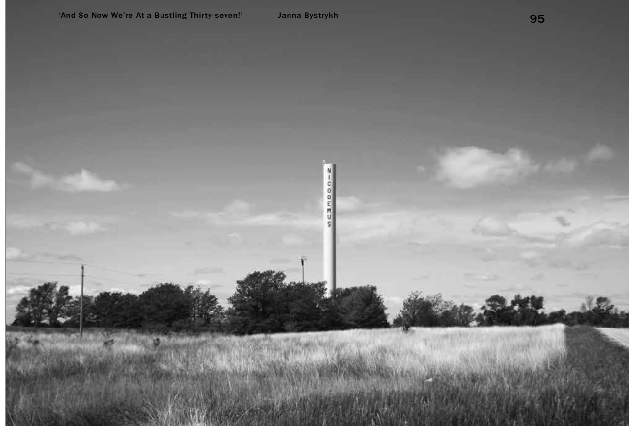
Nicodemus water tower, possible future location of the National Historic Site Visitor Centre, May 2021/ Watertoren van Nicodemus, mogelijk de toekomstige locatie van het National Historic Site Visitor Centre, mei 2021

can expand the common idea of a small rural town, what is urban and what is rural, what it means to build out different forms of autonomy and identity in a rural landscape, how possible futures for many people have been skewed by preconceptions, violence and discrimination, and the need for inclusion of multiplicity of perspectives and histories in future visions.