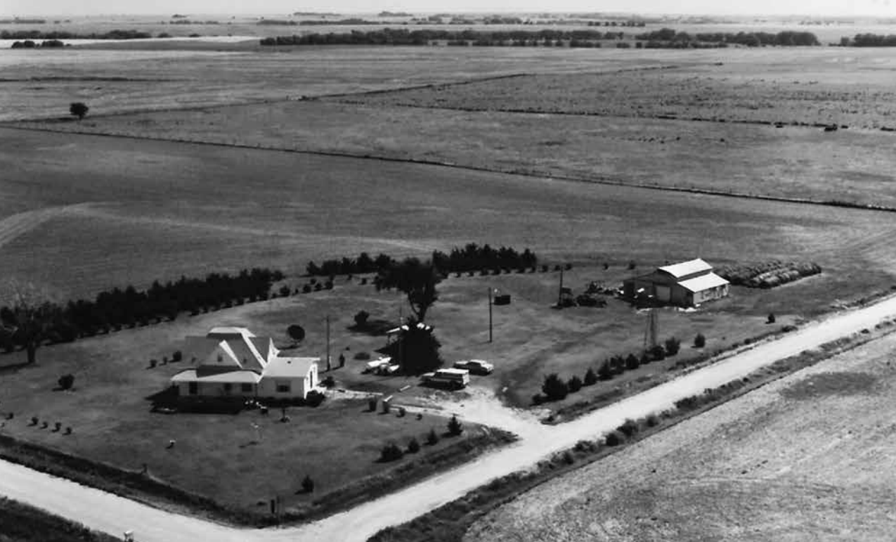
Bates Farm (40 acres/ 16 ha) that extends to include the first green field with the lone tree, beyond the tilled field. Photograph from the 1980s/ Bates Farm (40 acres/ 16 ha) strekt zich uit tot en met het eerste groene veld, met de eenzame boom, verderop het bewerkte veld. Foto uit de jaren 1980

oudere generatie boeren, met kinderen die niet willen boeren. Waarom blijft het land niet beschikbaar zodat wij het kunnen kopen en bewerken? Waarom vormen we geen partnerschappen, zodat zulke mensen opvolgers hebben? We kunnen heel veel dingen doen om BIPOC-boeren te helpen om het land opnieuw te bewerken en bezitten. We kunnen programma's organiseren en begeleiding regelen voor nieuwe boeren, vrouwelijke boeren, hen helpen met het verkrijgen van certificaten en bedrijfsnummers.