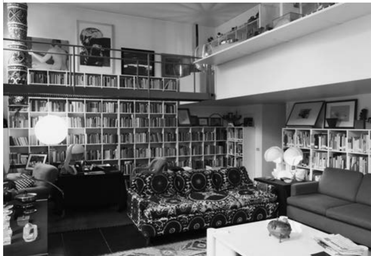
Gae Aulenti's home office, now the Aulenti Archive, via Fiori Oscuri, Milan/ Gae Aulenti's kantoor-aan-huis, nu het Aulenti Archive, via Fiori Oscuri, Milaan