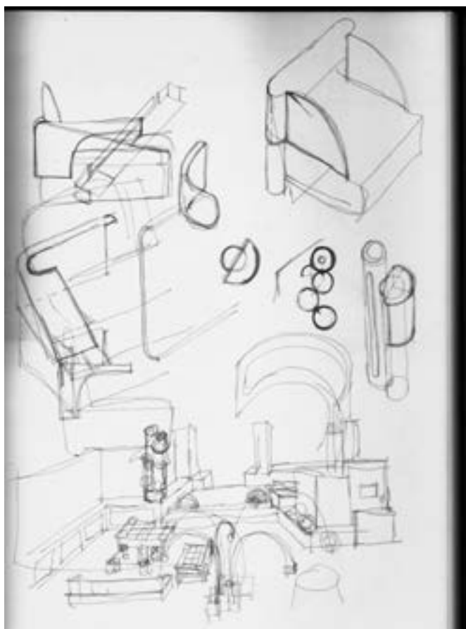
Sketch/ schets by/ door Gae Aulenti n.d./ z.d.

16 Hoewel het niet eenvoudig was om de argumenten die tijdens de bijeenkomsten bij Aulenti thuis aan de orde kwamen, nauwkeurig te reconstrueren, hebben we enkele onderwerpen die mogelijk werden besproken afgeleid uit aantekeningen in dagboeken die zijn gevonden in Aulenti's thuisarchief in Milaan. In haar Agenda Rimbaud uit 1998 staan bijvoorbeeld opmerkingen over het Fenice ('3.3.ua.04 Agende e agendine varie').