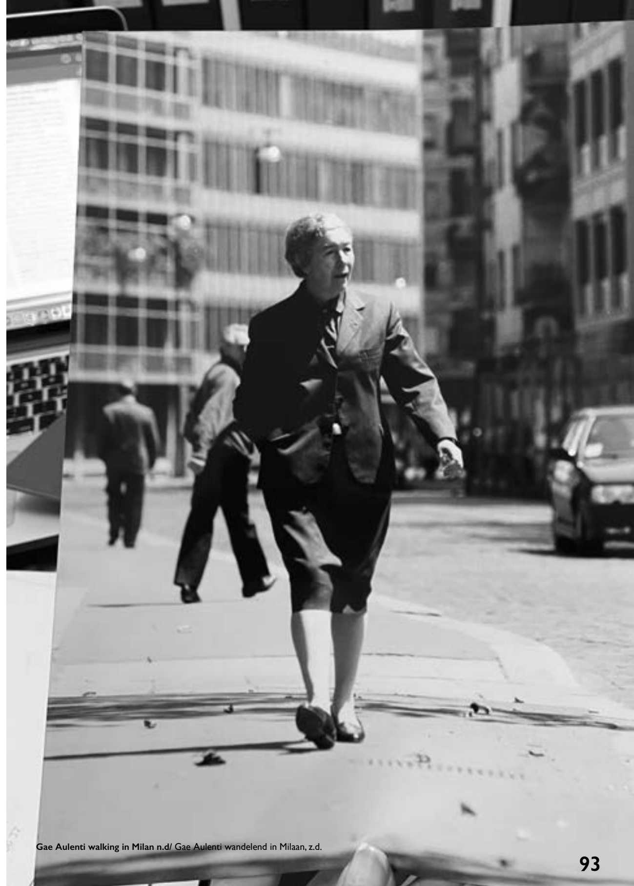
Gae Aulenti walking in Milan n.d/ Gae Aulenti wandelend in Milaan, z.d.