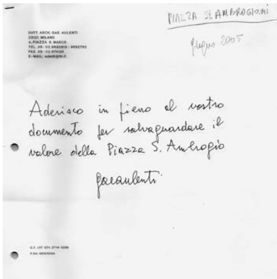
Petition signed by Gae Aulenti, endorsing the document to save Piazza S. Ambrogio in Milan, June 2005/ Door Gae Aulenti ondertekende petitie om het Piazza S. Ambrogio in Milaan te redden, juni 2005