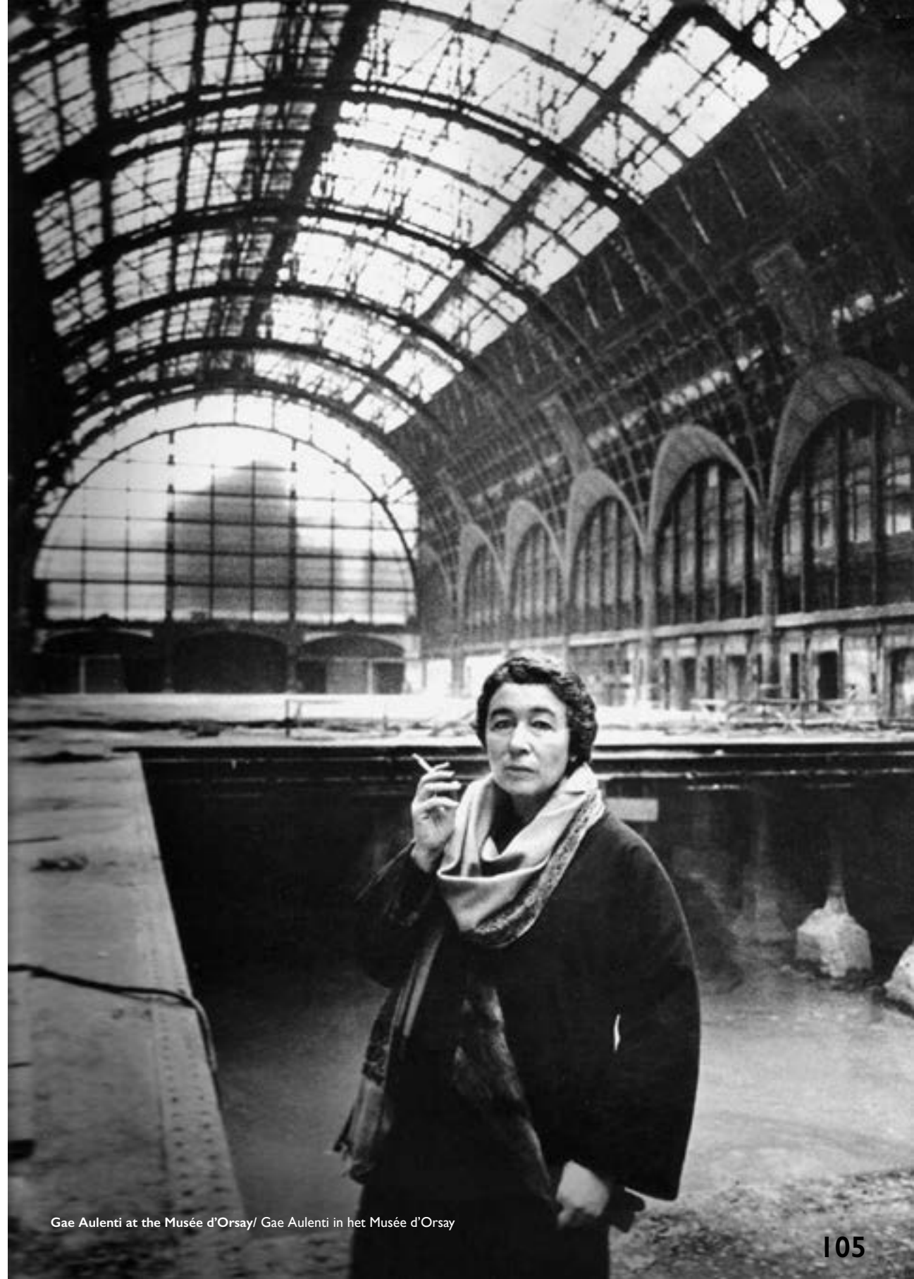
Gae Aulenti at the Musée d'Orsay/ Gae Aulenti in het Musée d'Orsay

Gaetana Aulenti in: Renato Romanelli, 'Gae Aulenti, la vita è una scoperta continua', Illustrato FIAT/ Percorsi 41 (juli 2003), 11.