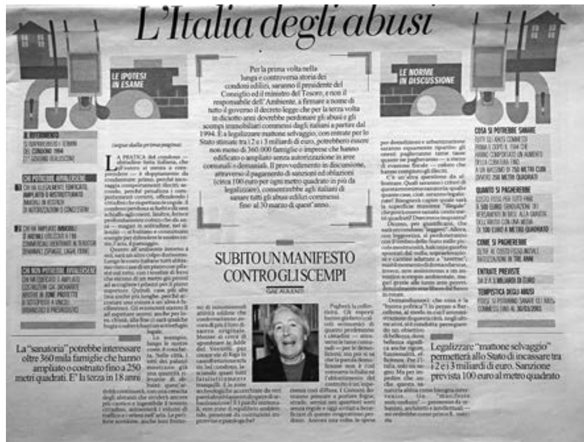
Gae Aulenti, 'L'Italia degli abusi' (Italy of abuses/ Het Italië van de misstanden). Article published in La Repubblica on 21 September 2003/ Artikel gepubliceerd in La Repubblica op 21 september 2003

The Street as a Link Between Civil Society and Politics If Aulenti's house was a centre for private and social life, it was from the street that the architect stepped onto the political stage. Siding with the Italian left, Aulenti always maintained a strong