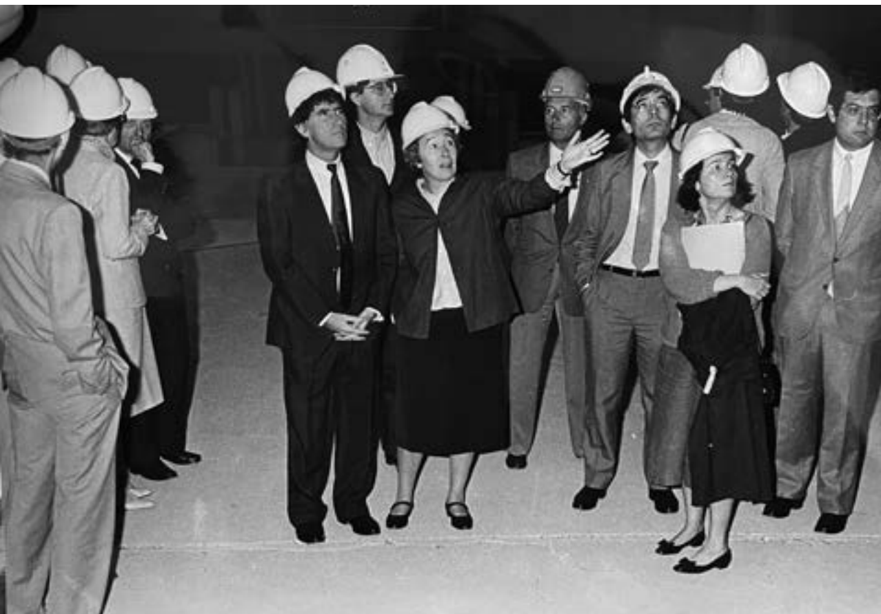
Gae Aulenti with Jack Lang (Former Minister of Culture of France) visiting the Musée d'Orsay in Paris, 1984/ Gae Aulenti en Jack Lang (voormalig minister van Cultuur van Frankrijk) op bezoek in het Musée d'Orsay in Parijs, 1984

Paolo Forcellini, 'Arrivano gli L&G', L'Espresso , 21 November 2002, 63.