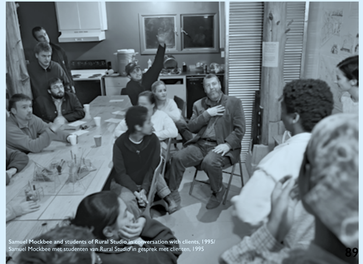
Samuel Mockbee and students of Rural Studio in conversation with clients, 1995/ Samuel Mockbee met studenten van Rural Studio in gesprek met klanten, 1995

Rural Studio was established in 1993 by American architect Samuel Mockbee (1944-2001). Dissatisfied with the development of his own practice, which was attracting increasingly wealthy clients, and with the difficulty of finding funding for the development of affordable housing for poor residents of the American South, he began to address this second challenge in his studio at the School of Architecture at Auburn University in Alabama. The studio combined a design-and-build approach with social ambitions to address the impoverished landscape of Hale County, one of the poorest regions in Alabama. Second-year students, who spend a year in the studio, work with and among local residents to design and build small community housing and civic projects, while fifth-year students are assigned to more complex projects. As well as designing and building the pro-