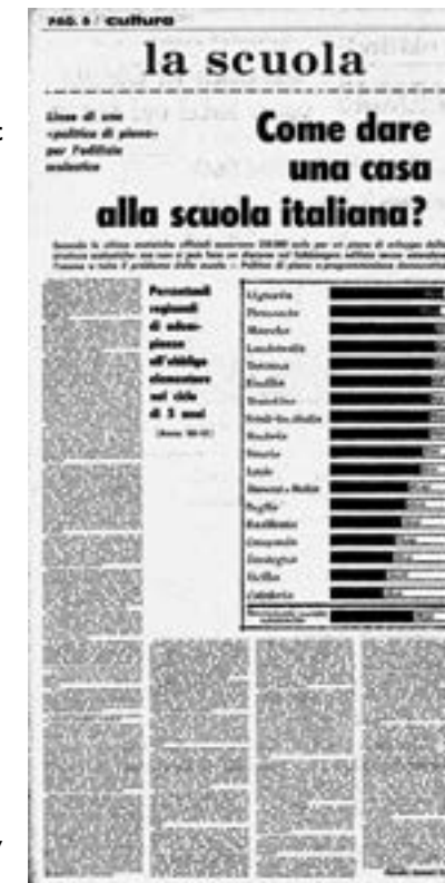
Article by Novella Sansoni in communist newspaper L'Unità . 'Come dare una casa alla scuola italiana?' (How to give the Italian school a home)/ Artikel van Novella Sansoni in de communistische krant L'Unità . 'Come dare una casa alla scuola italiana?' (Hoe geef je de Italiaanse school een thuis?)

10 Ibid., 107. 11 Ibid., 42. 12 Ibid., 43. 13 Novella Sansoni, L'Unità (6 July 1979), 10.