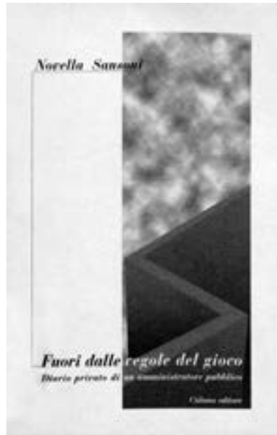
Cover of Novella Sansoni's memoir Fuori dalle Regole del Gioco / Omslag van Novella Sansoni's memoires Fuori dalle Regole del Gioco

11 Ibid., 42. 12 Ibid., 43. 13 Novella Sansoni, L'Unità (6 juli 1979), 10.