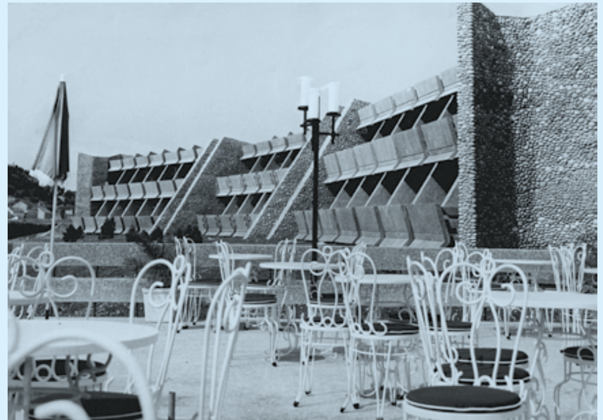
Svetlana Kana Radević, Hotel Podgorica, 1967