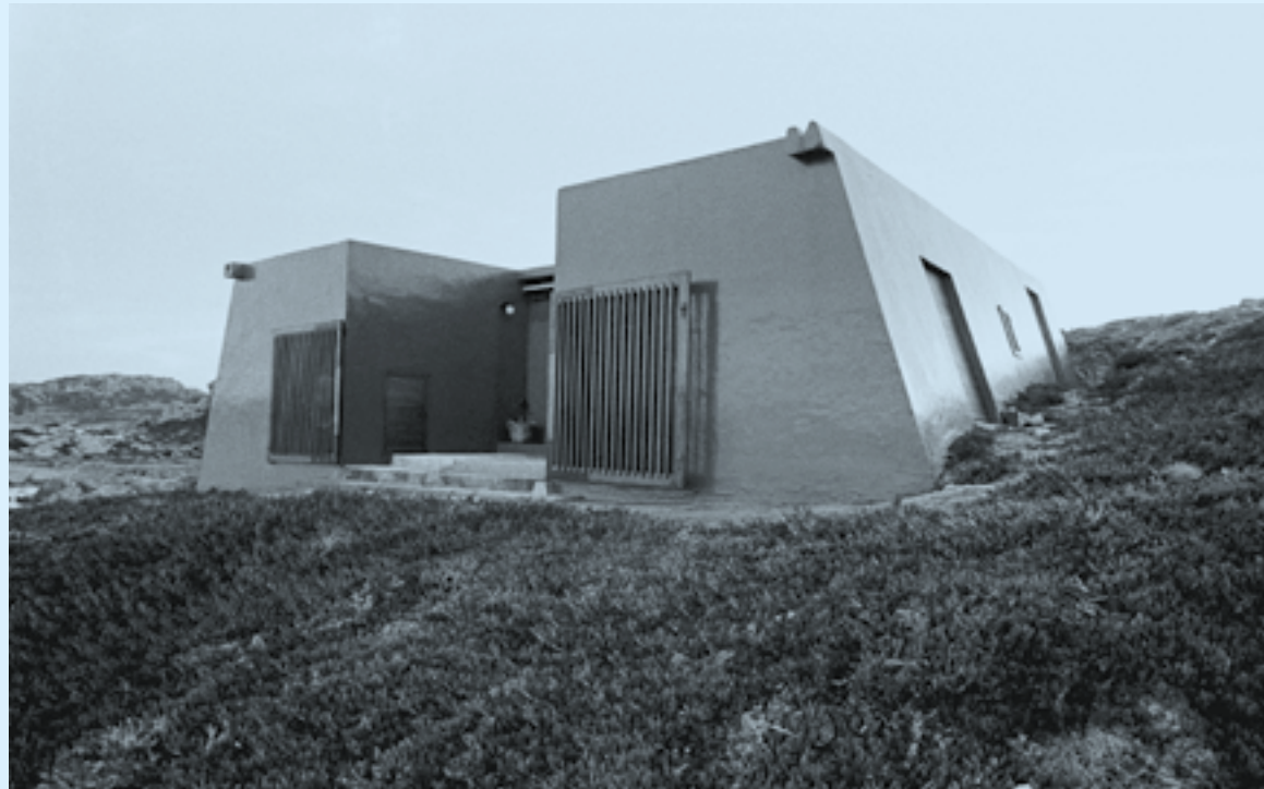
Cini Boeri, Casa Bunker, 1972

Virginia Woolf, A Room of One's Own (London: Hogarth Press, 1935 [1929]), 6