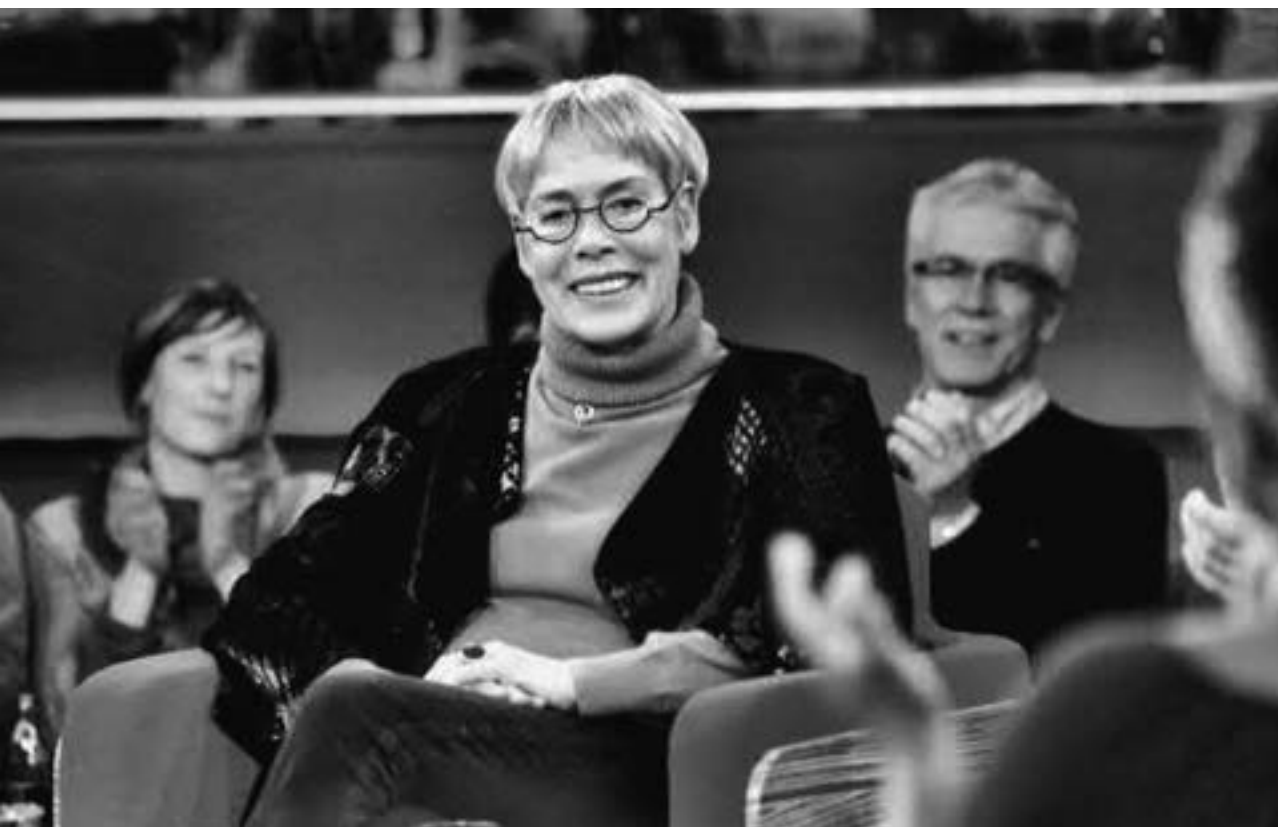
On television, Tietjen und Hirschhausen , 2011 / Op televisie, Tietjen und Hirschhausen , 2011