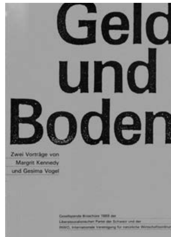
Early contribution (1989) for a conference on money and land in Switzerland/ Vroege bijdrage (1989) voor een conferentie over geld en grond in Zwitserland