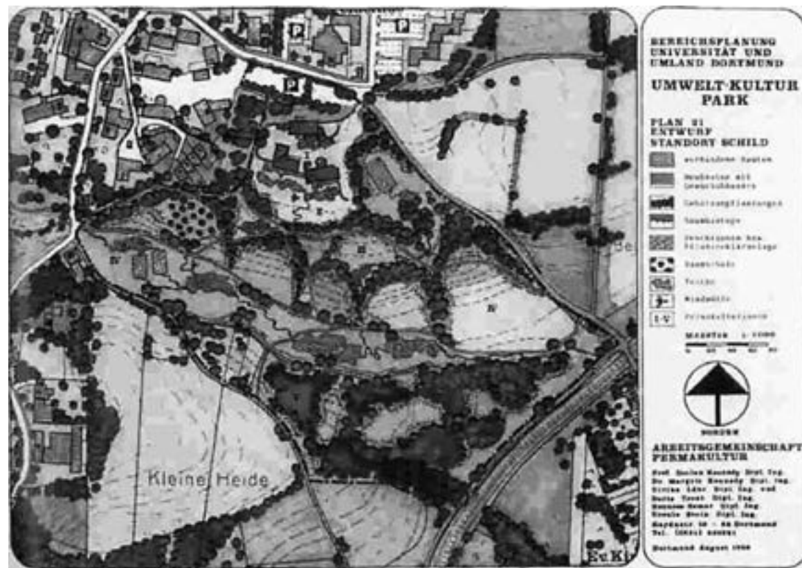
Submission to IKEA International Design Competition/ Inzending voor de internationale ontwerpwedstrijd van IKEA

Margrit Kennedy, 'Geld geht auch anders: Gute Gründe, Geld neu zu gestalten', erziehungskunst 01 (2012).