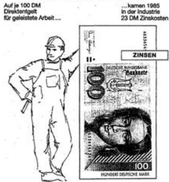
'Have you ever seen money working?'/ 'Heb je ooit geld gezien dat aan het werk was?' 'Work costs more than just a salary'/ 'Werk kost meer dan alleen een salaris'