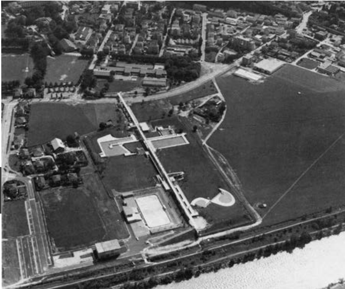
Aerial view of the Bagno Pubblico site in Bellinzona with the territorial points of reference/ Luchtfoto met de oriëntatiepunten van de locatie van het Bagno Pubblico in Bellinzona

spaces and plant rooms for technical equipment, and later also a non-swimmer pool. 3