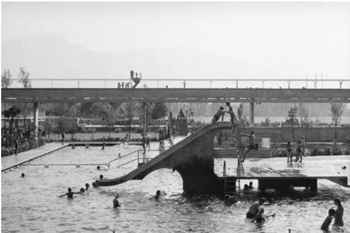
The Bagno Pubblico with its pool and the passerelle in the background/ Het Bagno Pubblico met het zwembad en de passerelle op de achtergrond

hoe de planning in twee hoofdfasen wordt verdeeld, een analytische en een synthetische. Twee kolommen aan de zijkanten van het model beschrijven een ontwerprichtlijn: al naar gelang het algemene belang afneemt, wordt het detailniveau hoger. De centrale termen echter, in het midden van de grafiek, roepen een heel andere categorie instrumenten op, voortkomend uit het geestelijk en zinnelijk domein, namelijk 'wens' en 'gevoel'. Het zoeken naar de oplossing doorloopt een serie analytische processen en zijscategorieën van de architectonische planning. In het middelpunt blijven echter de persoonlijke drijfveren van 'wens' en 'gevoel' staan, die de artistieke creatie tot iets onverwisselbaars maken, het handschrift van de auteur. Een complex, gedifferentieerd construct, dat met inlevingsvermogen te begrijpen is, maar niet toegankelijk is voor een oppervlakkige esthetische receptie.