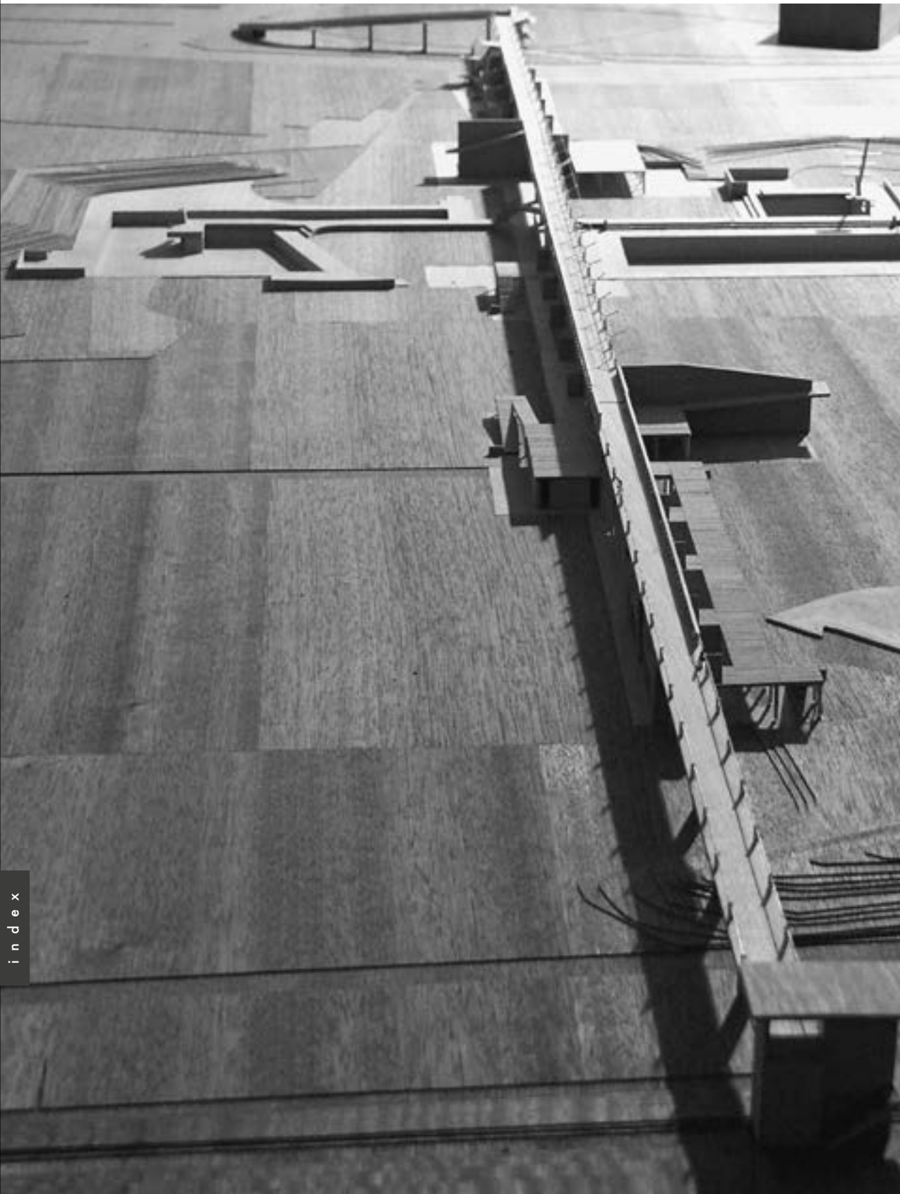
Bagno Pubblico, model/ maquette

bathing facility for the inhabitants of Bellinzona was a perfect match for the team of architects' sense of political responsibility towards the requirements of a public service. In addition, it presented a specific urban-territorial challenge that they approached with creative desire and inventiveness. Here they were also able to incorporate the theme of the periphery, a concept that gained increasing relevance in the 1960s in left-wing architecture discourse, into the planning procedure.