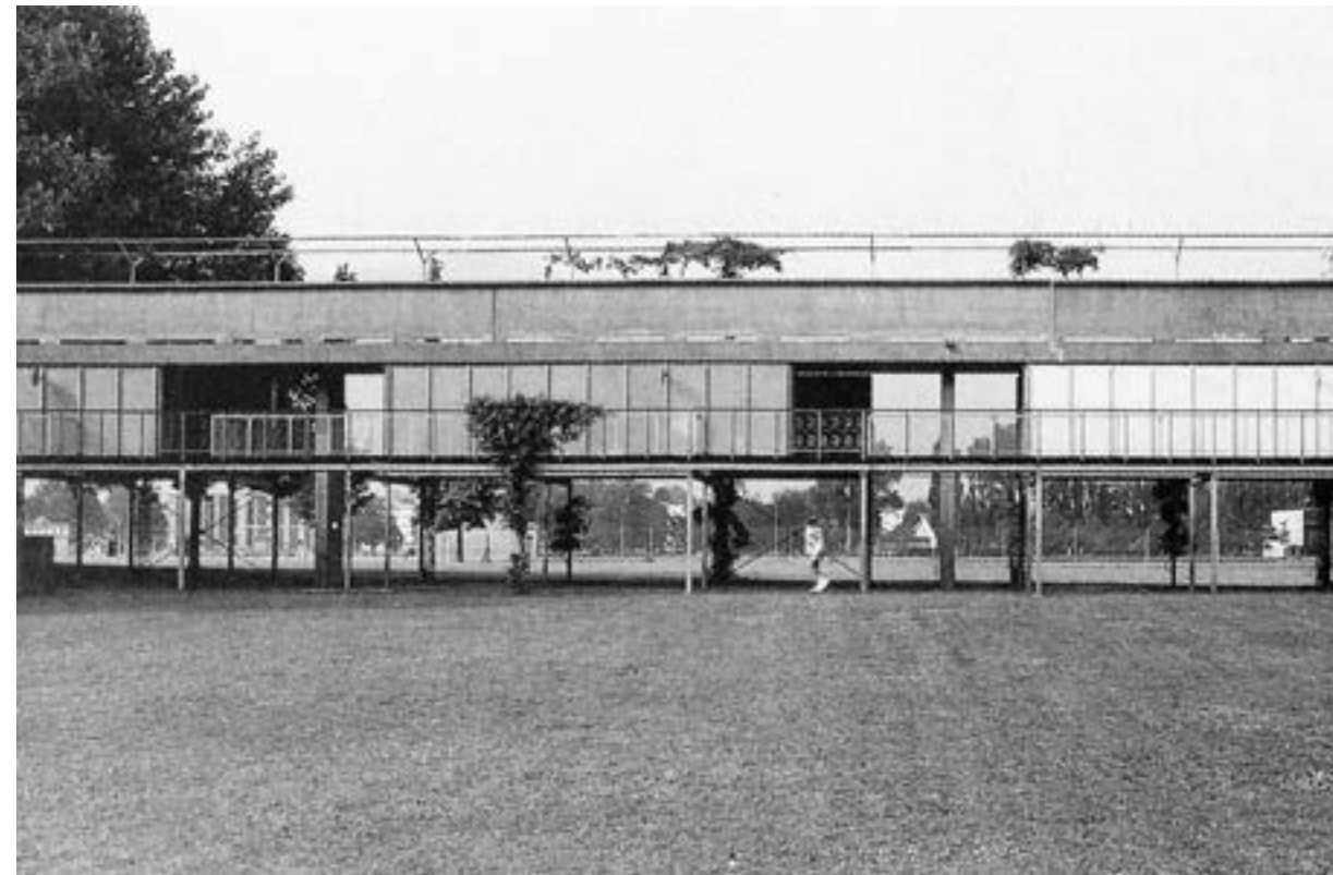
The Bagno Pubblico, passerelle/ Het Bagno Pubblico, de verhoogde voetgangersbrug

Walter Gropius, Architettura integrata (Milaan: Il Saggiatore, 1963); Walter Gropius, Scope of Total Architecture (New York: Harper & Bros, 1955).