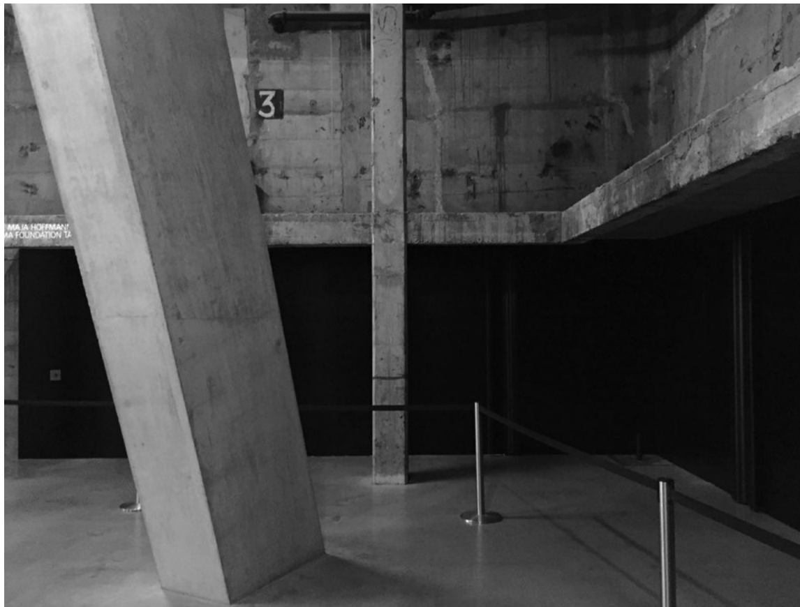
Tate Modern, London/ Londen. The/ de Tank Rooms (2016)

being a metropolitan public; they are players within the spectacle of the space and a drama of a sociocultural phenomenon that reinforces the spell it holds, and disempowers them. The imagery of this interior suggests a vast scene of industrial production that has been transformed into a realm of cultural production, while its circulation system alludes to the democracy of consumption and its relation to entertainment. From this space, further spectacle would seem to be obligatory: interiors of vast extent, panoramic views over the city.