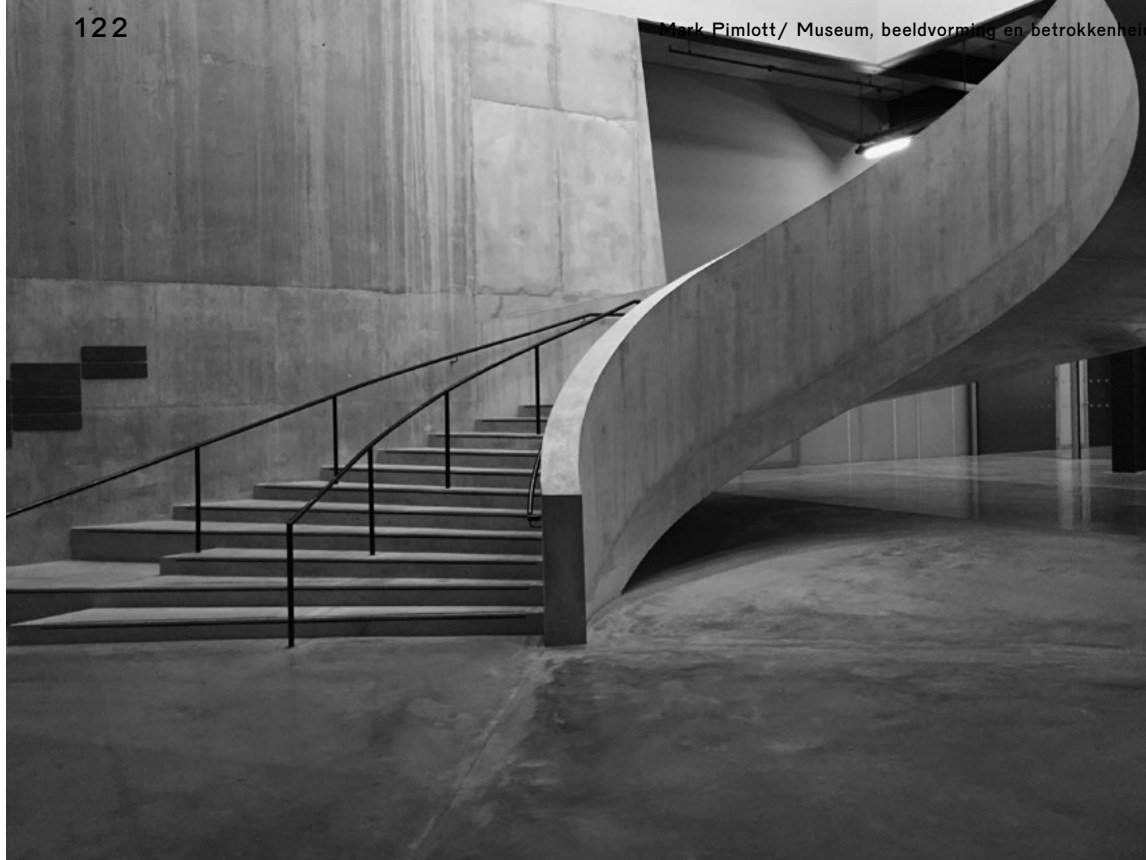
Tate Modern, London/ Londen. Blavatnik Building (2016), staircase/ trap