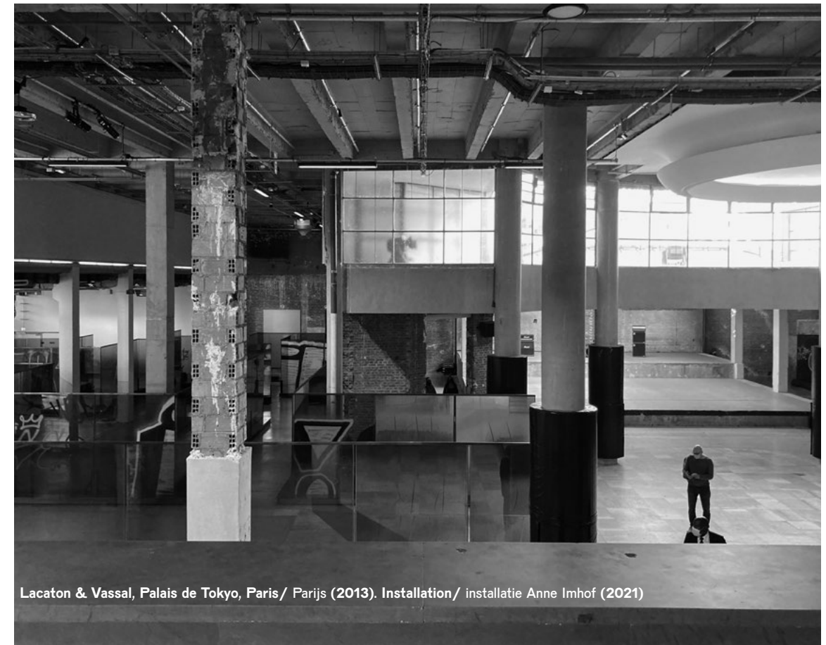
Lacaton & Vassal, Palais de Tokyo, Paris/ Parijs (2013). Installation/ installatie Anne Imhof (2021)