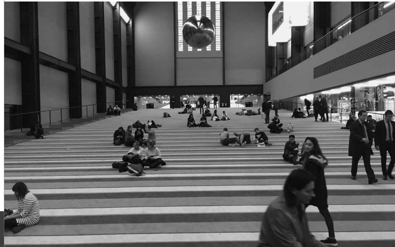
Herzog + de Meuron, Tate Modern, London/ Londen (2000). Turbine Hall, with striped carpet flooring as part of/ met gestreept vloertapijt als onderdeel van SUPERFLEX's One Two Three Swing! project (2016)

The project for Tate Modern's first phase deployed what became the typical tropes of the contemporary art museum as set out previously. It first offered an image to the city, directed towards publicity-aligned culture in the form of the Power Station and its chimney, its scale and presence attuned to the notion of the urban icon, complete with its own dedicated footbridge. There is an introductory, spectacular interior, the Turbine Hall, a 'raw' space alluding to the imagined 'found' spaces of former industrial (and art) production. The Turbine Hall conforms to the scale of metropolitan public interiors, here providing the imagery of a singular public interior akin to the grand magasins , or the exhibition halls, markets and train stations of metropolitan cities in the nineteenth century. In such spaces, the public, who yearn for engagement, see themselves