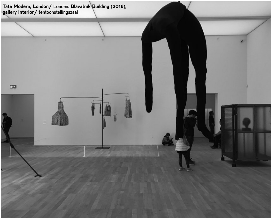
Tate Modern, London/ Londen. Blavatnik Building (2016), gallery interior/ tentoonstellingszaal