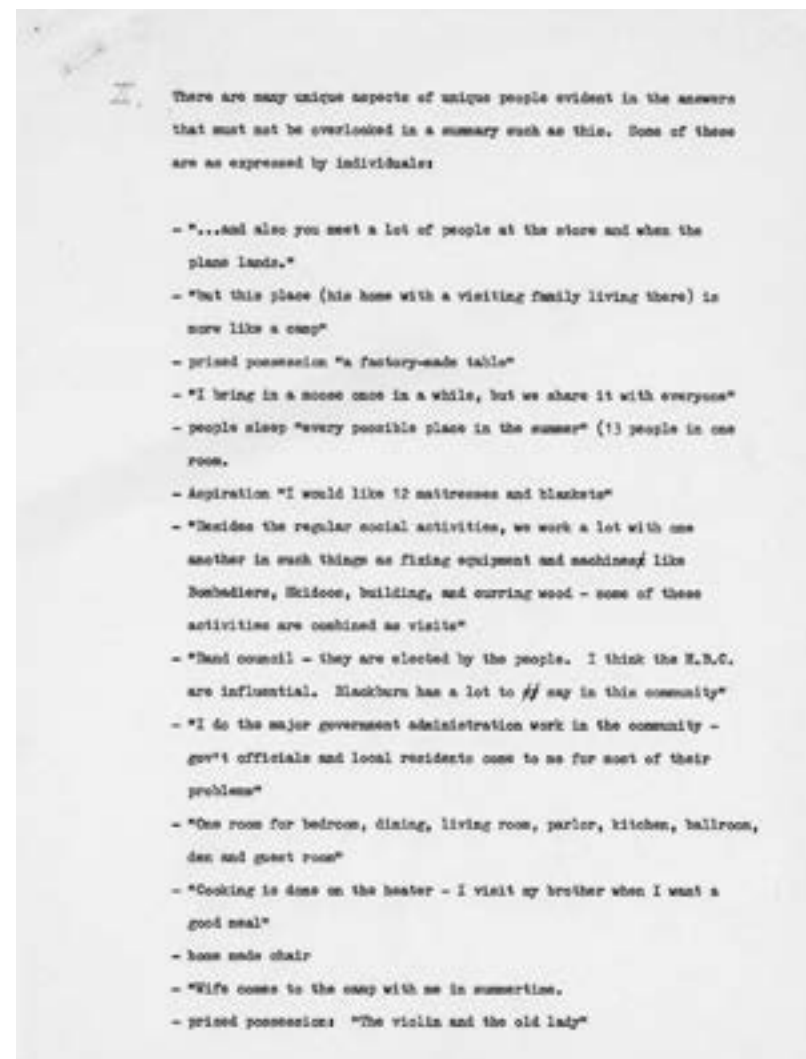
Notes for South Indian Lake, Manitoba (February 1967)/ Aantekeningen over South Indian Lake, Manitoba (februari 1967)

Het Churchill River Diversion-project werd in 1970 goedgekeurd en in 1976 voltooid. Het leidde de rivier de Churchill om naar Split Lake en vervolgens naar de lager gelegen rivier de Nelson. Uiteindelijk werd de herhuisvesting voltrokken, terwijl er nauwelijks overleg of samenwerking had plaatsgevonden. De provincie gooide de ideeën van Lemco volledig overboord.