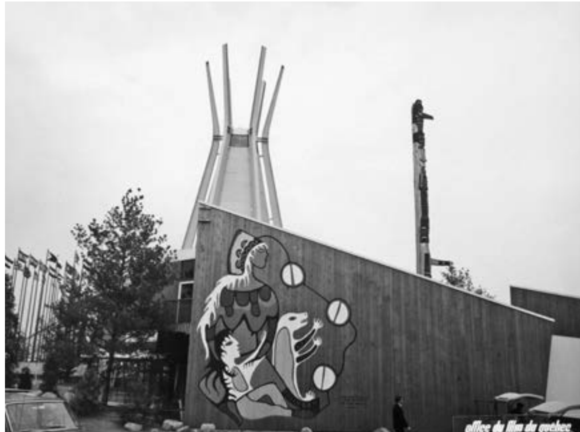
Image of the 'Indians of Canada' pavilion. Earth Mother and Her Children by Carl Ray, 'Indians of Canada' pavilion, Expo '67 (Montreal, 1967). The mural, painted directly on the vertical cedar boards of the building, depicts the Earth Mother with long, white hair, a head covering and exposed breasts, along with a child with long black hair, and a white and yellow bear cub. A series of circular forms linked with black lines connects the figures to the ground plane/ Afbeelding van het 'Indians of Canada'-paviljoen. Earth Mother and Her Children door Carl Ray, 'Indians of Canada'-paviljoen, Expo '67 (Montréal, 1967). De muurschildering, die rechtstreeks op de verticale cederhouten planken van het gebouw was aangebracht, stelt een Moeder Aarde met lang wit haar, een hoofdtooi en blote borsten voor, samen met een kind met lang zwart haar en een wit en geel berenjong. Een reeks cirkelvormen verbonden door zwarte lijnen verbindt de figuren met de achtergrond

Van Ginkel Associates, Transition in the North , deel 1, op. cit. (noot 2), 5.