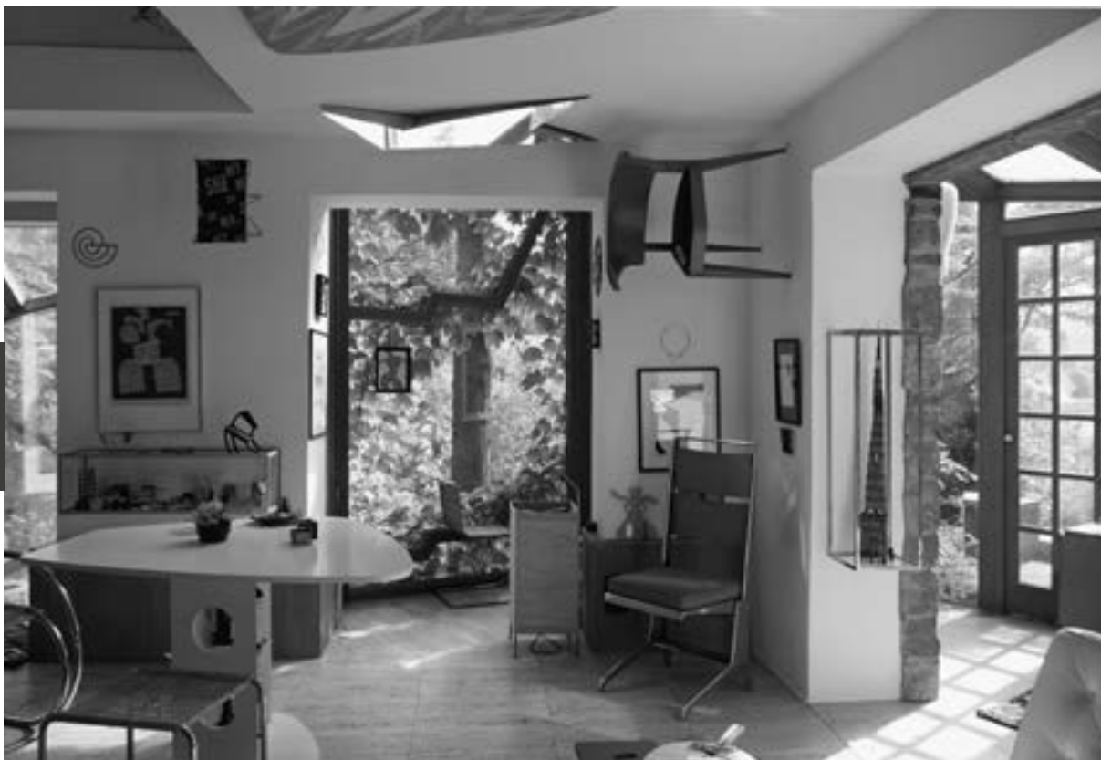
Alison Smithson, Painted Room Holes (1990)

a flat boundary but an ambiguous, in-between space in which a series of layers – seasons, light and shadow, trees and house, frame and inhabitants – converge.