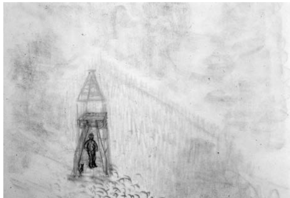
One of Alison Smithson's first sketches/ Een van de eerste schetsen van Alison Smithson (1986)