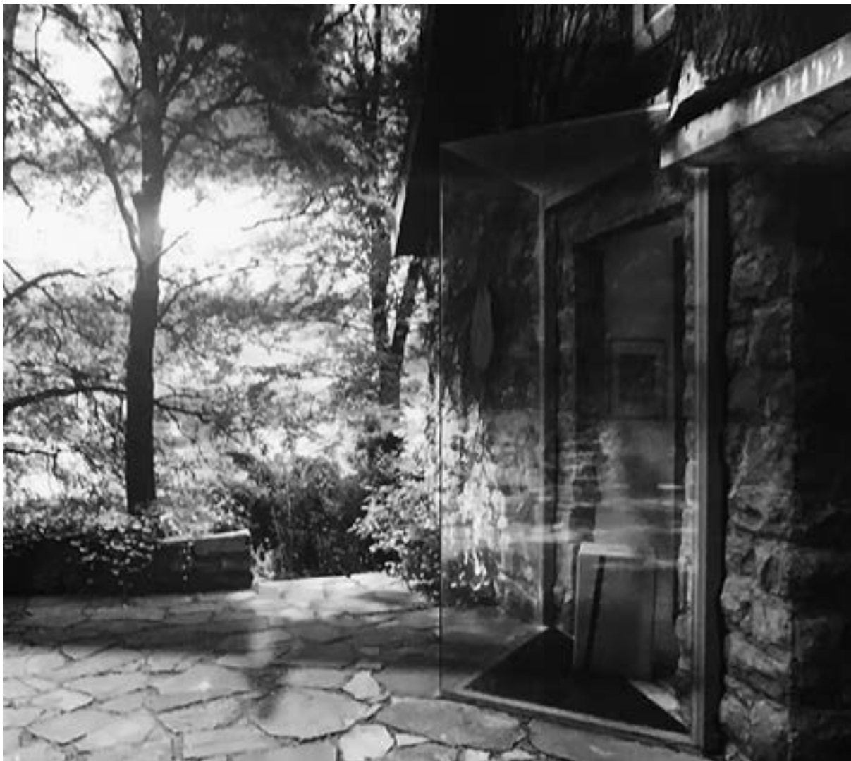
Stefan Wewerka, Triangular Front Window/ driehoekig raam aan de voorkant (1982)

elke beslissing een specifieke betekenis heeft en opnieuw in reflecties wordt gekanaliseerd. Alison legde het zó uit: