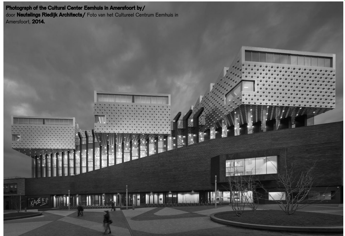
Photograph of the Cultural Center Eemhuis in Amersfoort by/ door Neutelings Riedijk Architects/ Foto van het Cultureel Centrum Eemhuis in Amersfoort, 2014.