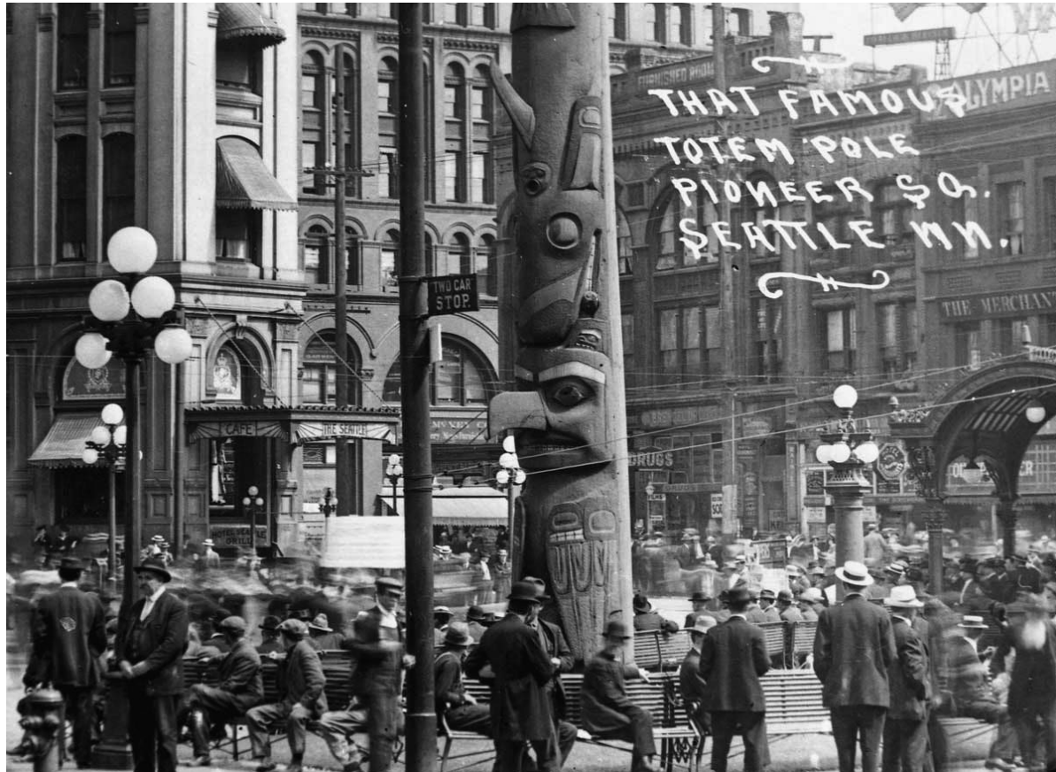
Tlingit Totem Pole at Pioneer Square, Seattle, early twentieth century/ Tlingit totempaal op Pioneer Square, Seattle, begin twintigste eeuw.