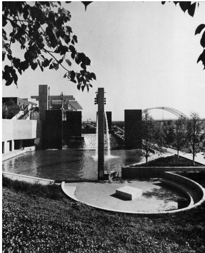
Concourse Fountain with exedra in foreground/ met de exedra op de voorgrond.