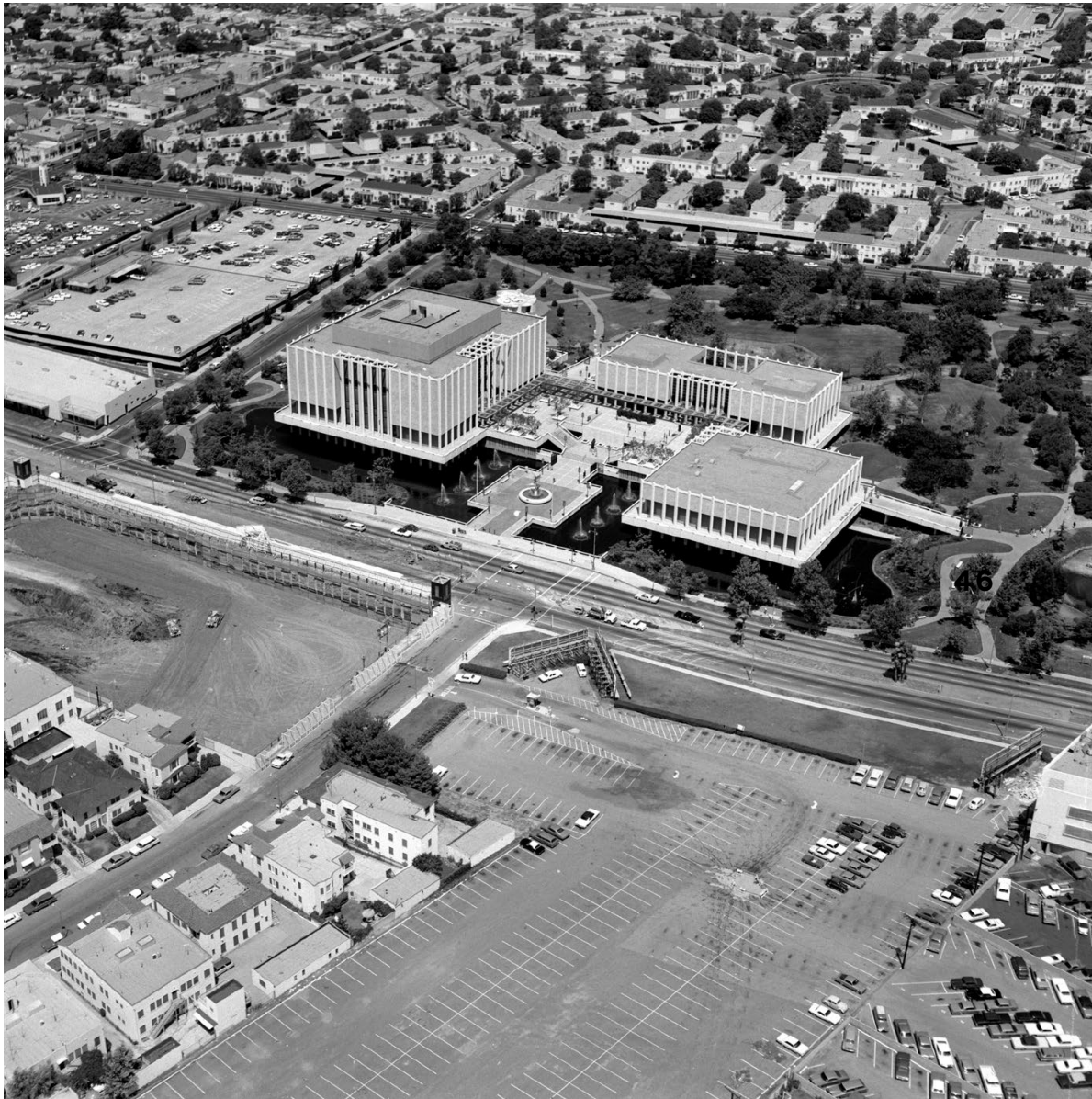
An aerial image of the LACMA campus/ Luchtfoto van de LACMA-campus, c. 1965.