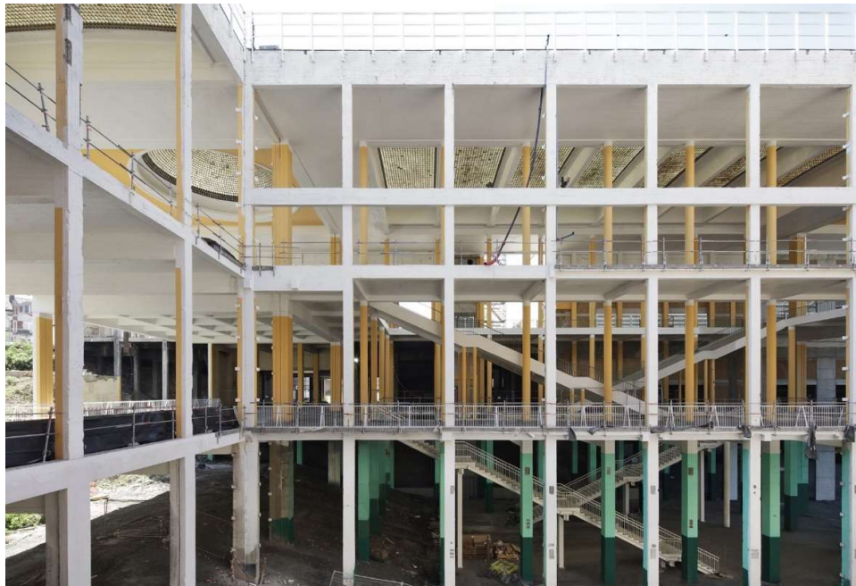
Balkrishna Doshi/Vastu-Shilpa Foundation, Aranya demonstratiewoningen en omliggend sites-and-services project, Indore, c. 1989. / AgwA srl civile en Architecten Jan de Vylder Inge Winck, Chapex, Charleroi, 2022.