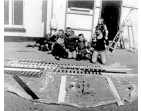
Patrick Bouchain – Construire, renovation of 60 social housing units in collaboration with residents, Boulogne-sur-Mer, 2013 / renovatie van 60 sociale huurwoningen samen met bewoners, Boulogne-sur-Mer, 2013

Pauline Fockedeey, Christoph Grafé, Véronique Patteeuw Parijs, 10 september 2019