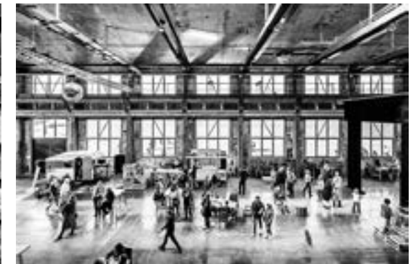
Encore Heureux, conversion of an industrial hangar into a 'third space', Colombelles, 2019/ verbouwing van een bedrijfshal tot semi-publieke ruimte, Colombelles, 2019