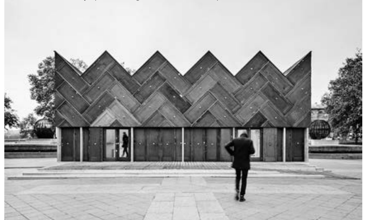
Encore Heureux, Pavillon Circulaire, demonstration pavilion for the reuse of building materials, Paris, 2015/ Pavillon Circulaire, demonstratiepaviljoen voor het hergebruik van bouwmaterialen, Parijs, 2015

Pauline Fockedeij, Christoph Grafé, Véronique Patteeuw Parijs, 10 September 2019