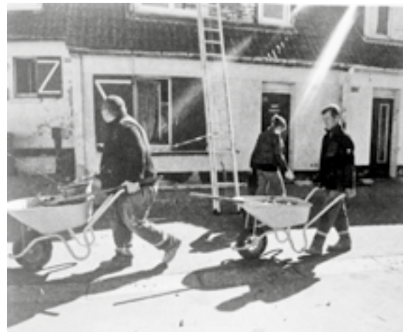
Patrick Bouchain – Construire, renovation of 60 social housing units in collaboration with residents, Boulogne-sur-Mer, 2013 / renovatie van 60 sociale huurwoningen samen met bewoners, Boulogne-sur-Mer, 2013