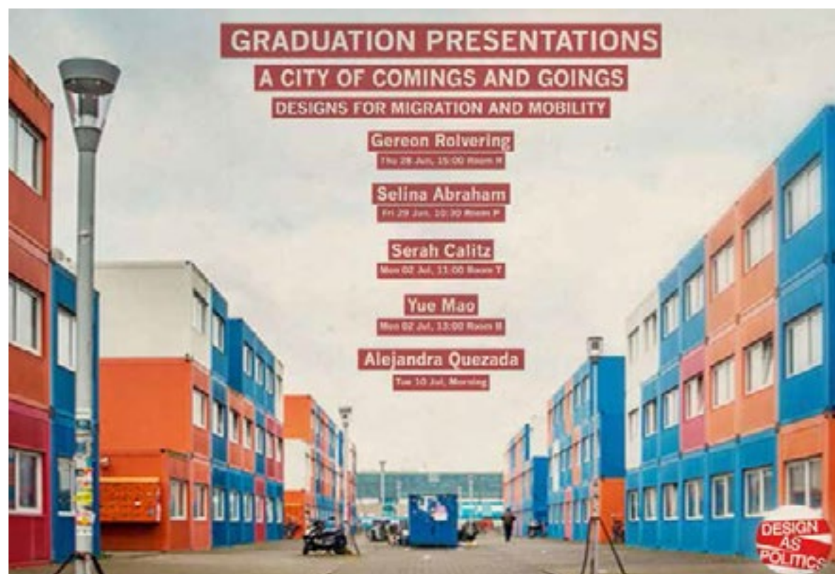
Studio ‘Design as Politics’, TU Delft, 2018