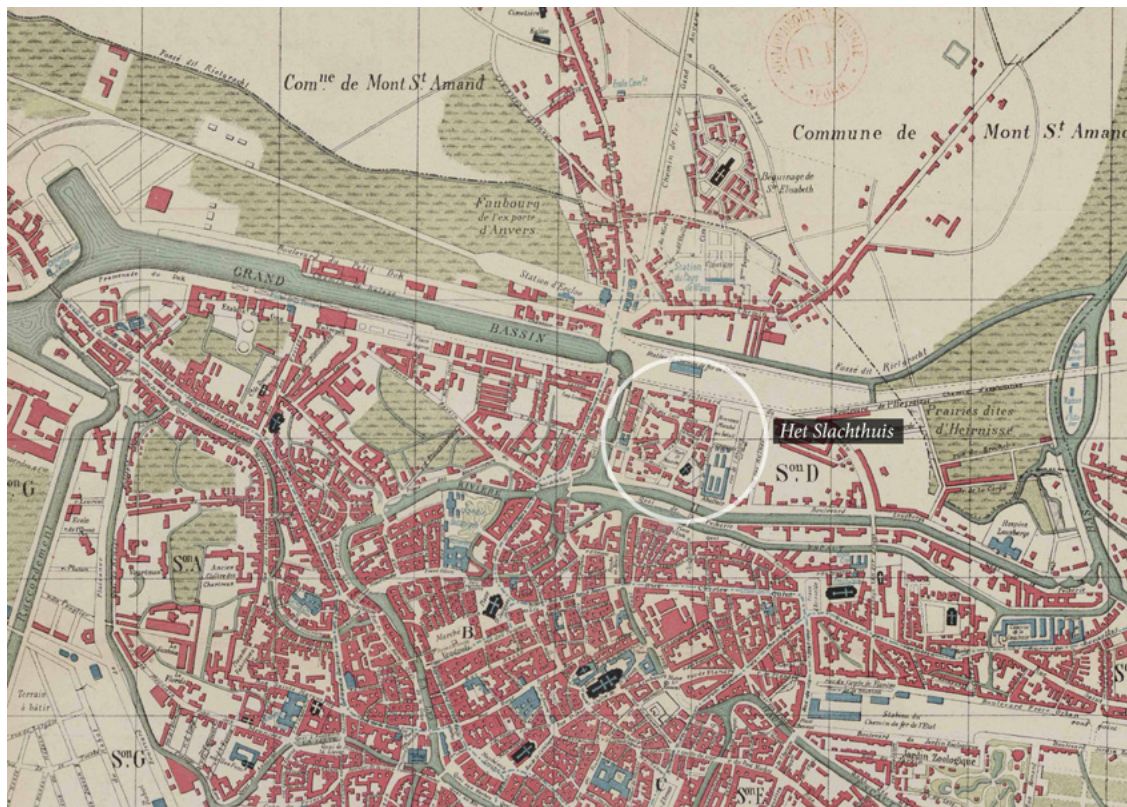
The eastern border of Ghent, with the Slaughterhouse/De oostelijke rand van Gent, met het slachthuis.

The Urban Household of Metabolism/ Het stedelijk huishouden van het metabolisme case 104