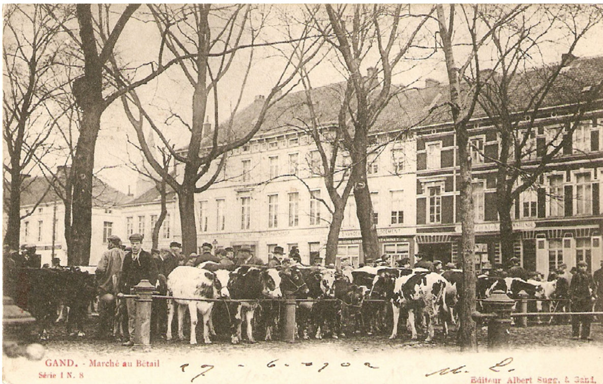
Postcard of the animal market with cafés and shops in the background/ Briefkaart van de beestenmarkt met cafés en winkels op de achtergrond

The Urban Household of Metabolism/ Het stedelijk huishouden van het metabolisme case 104