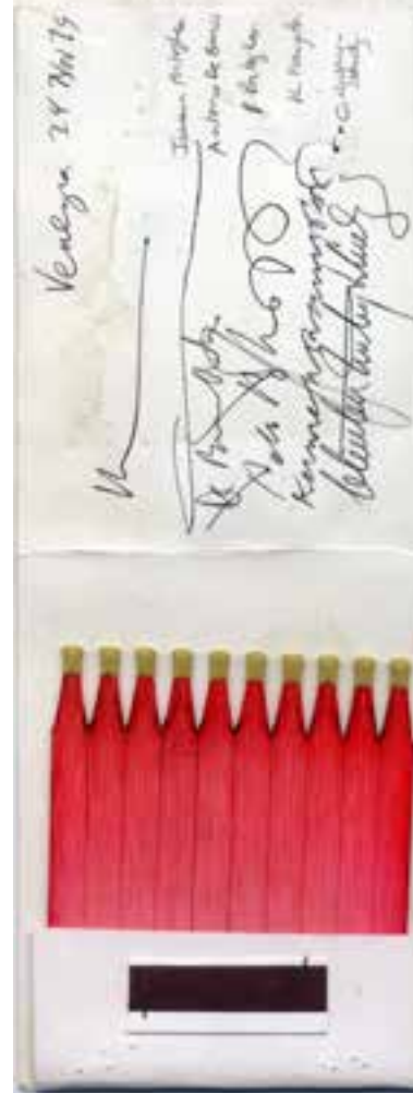
Souvenir de Venise, Advisory Committee meeting, Venice, 24 November 1979/ Souvenir van vergadering adviescommissie, Venetië, 24 november 1979

22 Stanford Anderson, 'Modern Architecture and Industry: Peter Behrens, the AEG, and Industrial Design', Oppositions , nr. 21 (zomer 1980), 83.