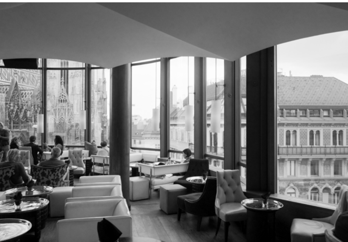
Hans Hollein, Haas Haus, 1990, Vienna/ Wenen, Austria/ Oostenrijk