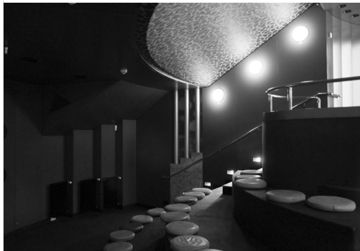
Hans Hollein, Museum Abteiberg, 1982, Mönchengladbach, Germany/ Duitsland