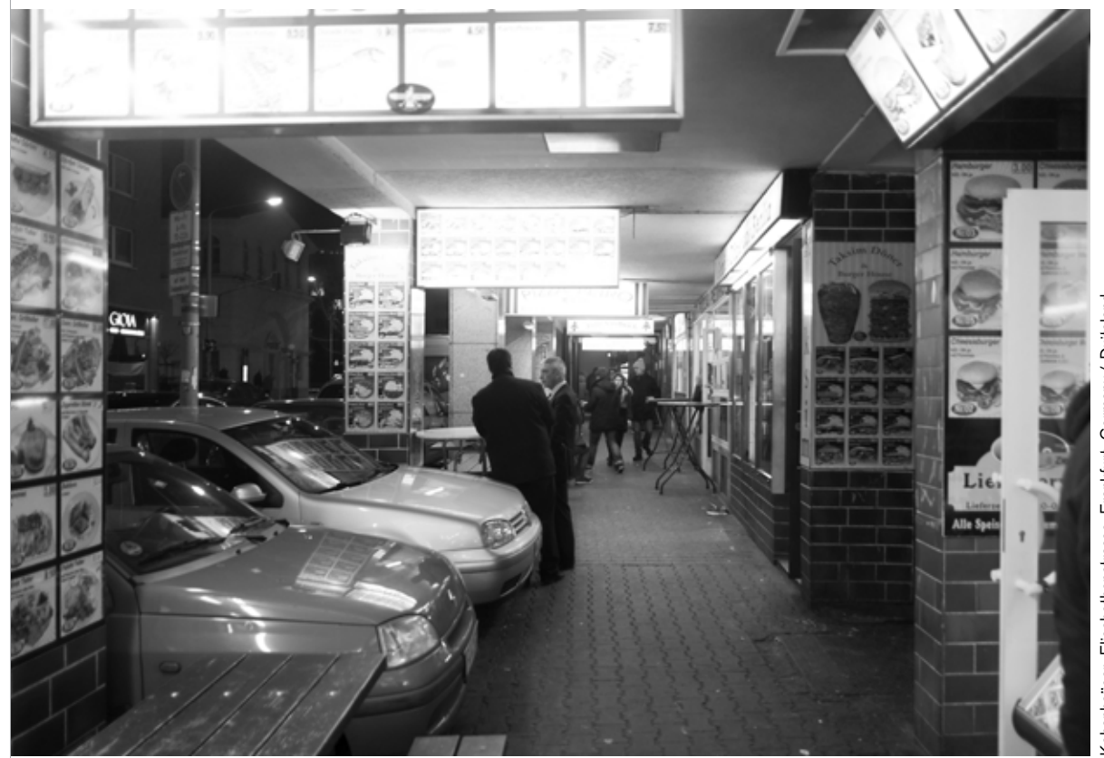
Kebaphäuser, Elisabethenstrasse, Frankfurt, Germany / Duitsland