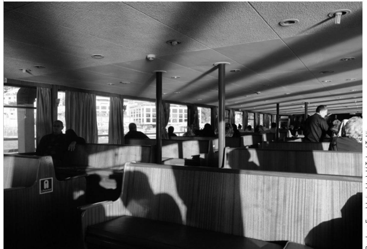
Bosphorus Ferry Interior, Istanbul / Turkey / Turkey / Turkey