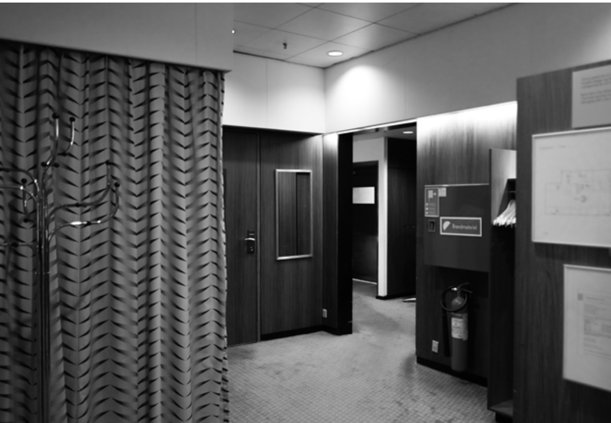
Arne Jacobsen, Radisson Sas Royal Hotel, 1960, Copenhagen / Copenhagen, Denmark / Denmark / Denmark