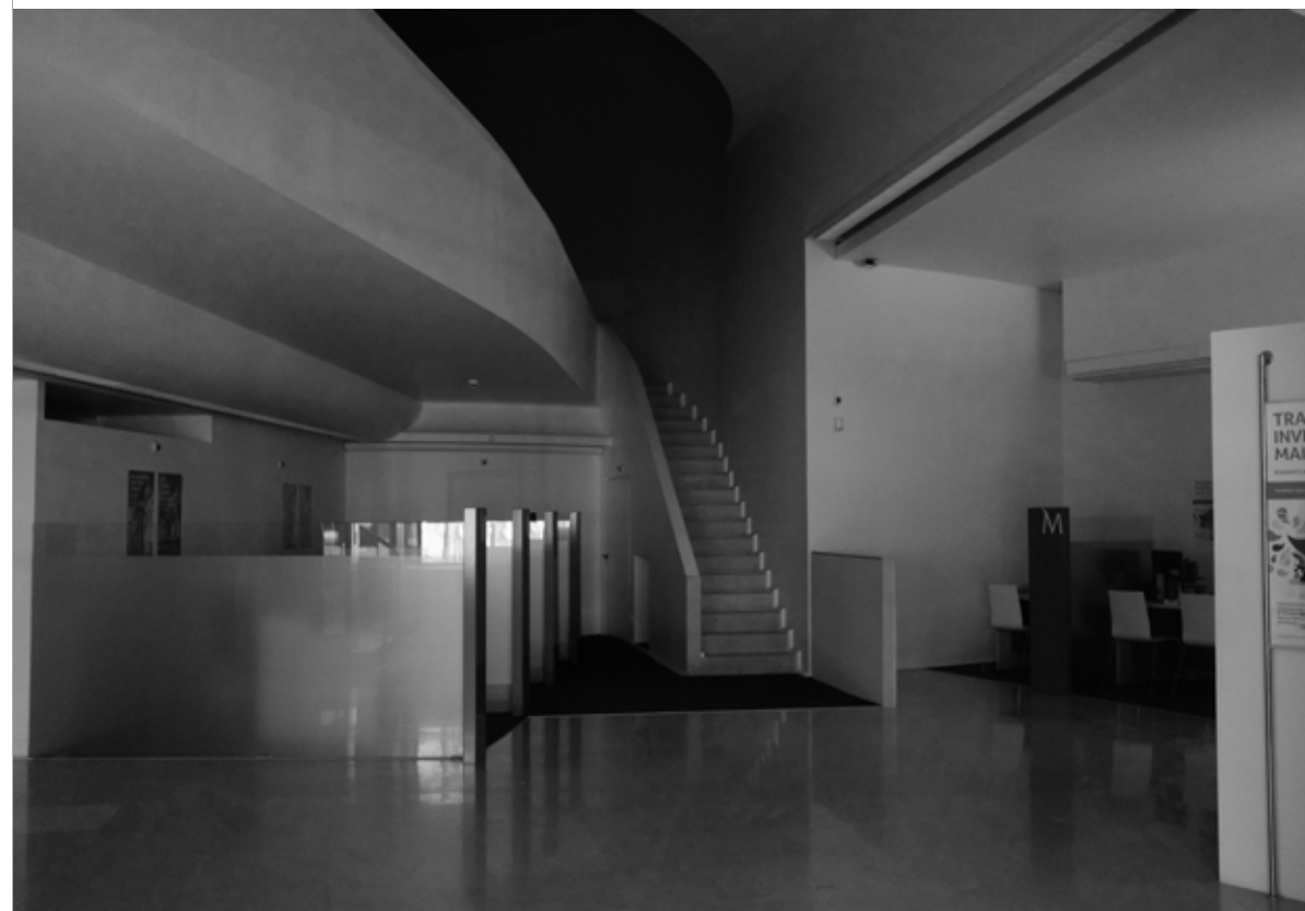
Álvaro Siza, Banco Pinto & Sotto Mayor, 1974, Oliveira de Azeméis, Portugal