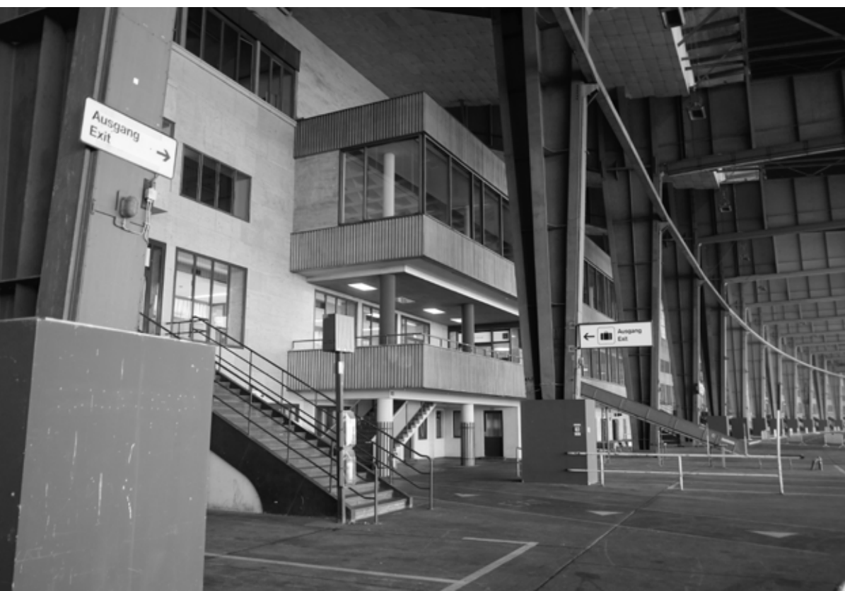
Ernst Sagebiel, Berlin Tempelhof Airport, 1934, Berlin / Berlijn, Germany / Duitsland