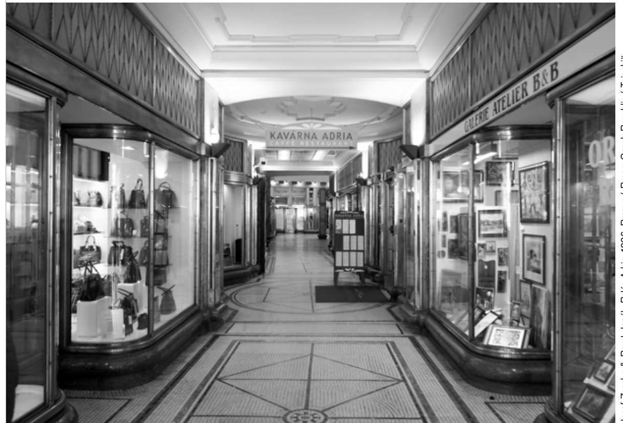
Josef Zasche & Pavel Janák, Palác Adria, 1926, Prague / Praag, Czech Republic / Tsjechië