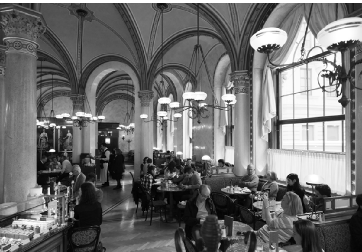
Café Central, 1876, Vienna/ Wenen, Austria/ Oostenrijk