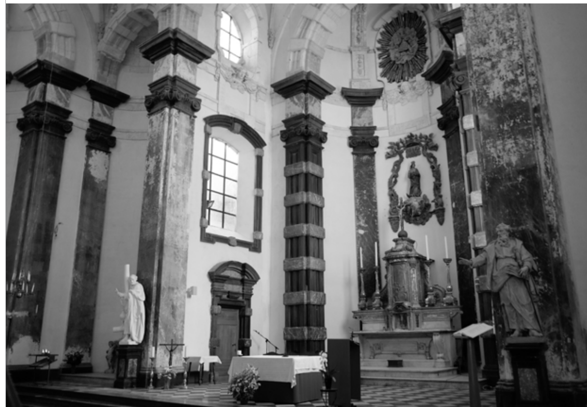
Lucas Faydherbe, Notre-Dame aux Riches Claires, 1665, Brussels / Brussel, Belgium / België