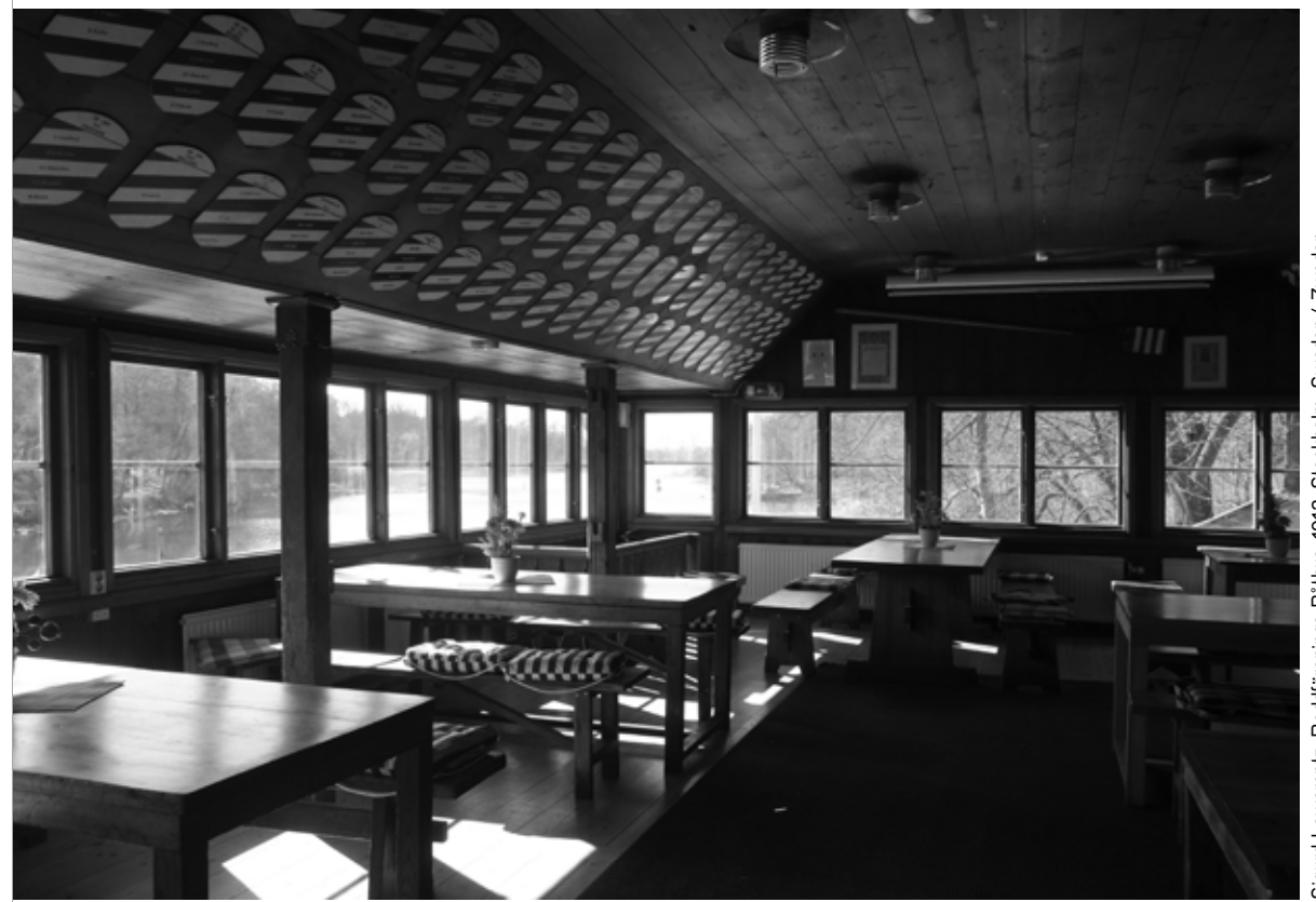
Sigurd Lewerentz, Roddförenings Båthus, 1913, Stockholm / Sweden / Sweden / Sweden