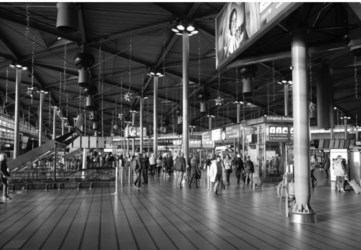
Bentham & Crouwel, Schiphol Plaza, 1995, Haarlemmermeer, the Netherlands / Nederland