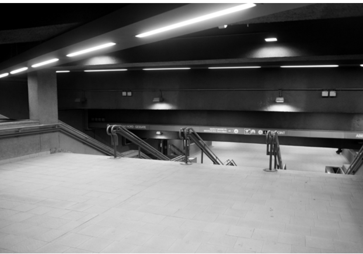
Franco Albini, Metropolitana Milanese stations, 1964, Milan / Milaan / Italië