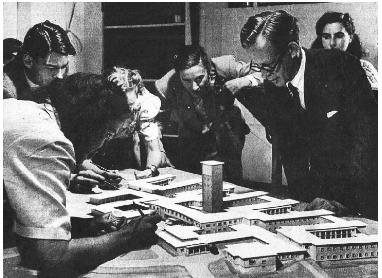
Jane Drew and Maxwell Fry / Jane Drew en Maxwell Fry

Maxwell Fry, Jane Drew en assistenten bekijken een maquette van het Ahmadi ziekenhuis, Koeweit, omstreeks 1942