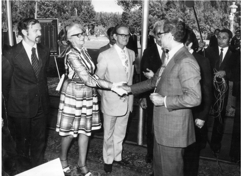
Jane Drew and Maxwell Fry / Jane Drew en Maxwell Fry