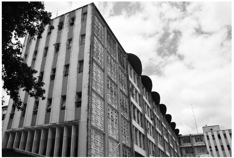
Aburi Girls School, Ghana, 1953 / Aburi meisjesschool, Ghana, 1953