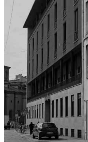
Luigi Caccia Dominioni, Piazza Sant' Ambrogio, Milaan, 1949-1953

Maar waar analoge architectuur een houvast heeft aan typologie, topologie en tektoniek, weet de digitale architectuur zich geen raad meer en wordt ze onderhevig aan elke vorm van willekeur. Beeld en betekenis zijn niet meer met elkaar verbonden, laat staan dat de laatste nog enige waarde zou hebben. Een Chinese