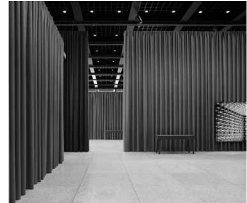
Caruso St. John + Thomas Demand, Nationalgalerie, Berlijn, 2010