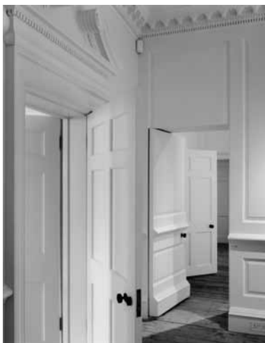
6A, Ravan Row Gallery, Londen, 2010

Analoog en digitaal, beeld en betekenis, modern en klassiek: het zijn begrippen die de architectuur van vandaag vasthouden. Jacques Derrida sprak al in 1985 over 'maintenant l'architecture' 1 . Architectuur vasthouden en in stand houden. Instandhouding heeft te maken met inzicht in structuren die deel uitmaken van het proces van architectonische ontwikkeling, zoals geschiedenis, theoretisch vermogen, uitdrukking, enz. Type en model spelen nu opnieuw een groot belang in het debat. Ook in het onderwijs staan deze begrippen centraal: elk ontwerp dient zich te verbinden met een theoretisch model, maar moet in situ een gepast antwoord bieden, wat niet wil zeggen dat reproduceerbaarheid de enige methodiek is. Quatremère de Quincy had het al over type en model, én over imitatie. Vandaag zijn er echter veel synoniemen die met deze begrippen enige verwantschap hebben, zoals citaat, referentie, duplicaat, afspiegeling, etc., maar elk begrip staat duidelijk voor een andere interpretatie van het oorspronkelijke. Oorsprong staat voor origine,