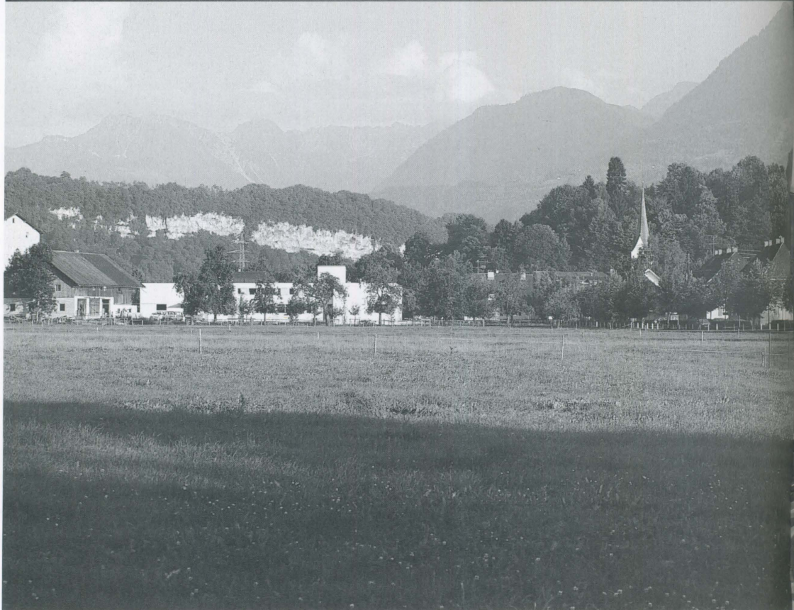
Haus Nofels, Binnenhof met fontein / Courtyard with fountain Het gebouw in zijn omgeving / The building and its surroundings