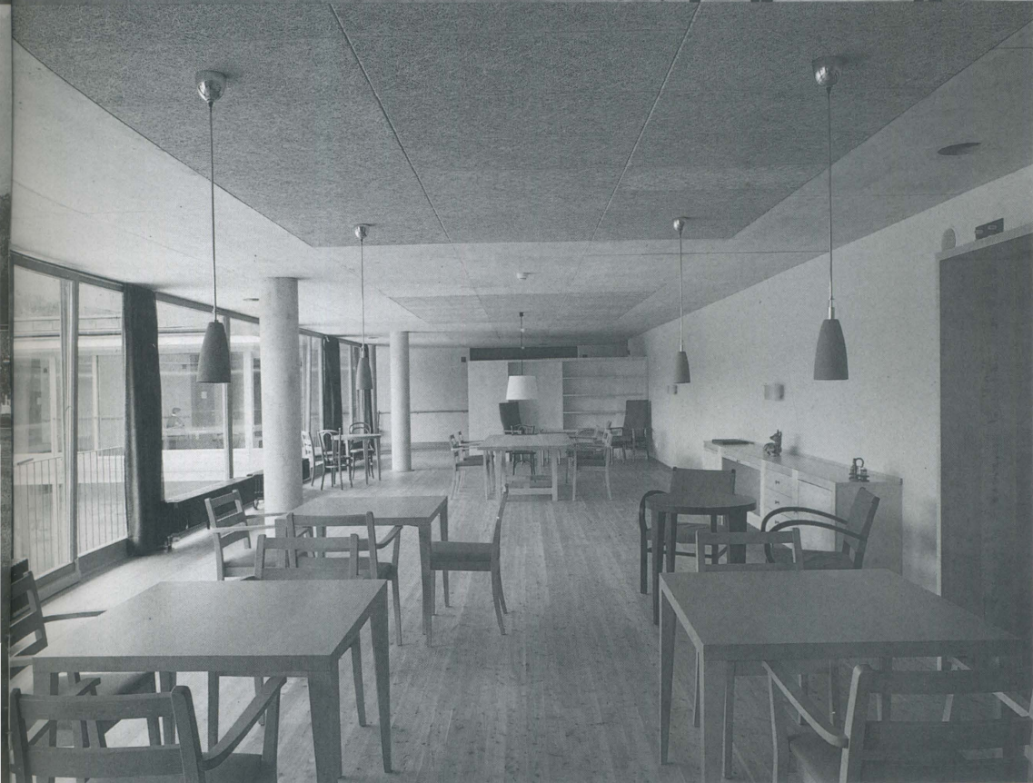
De woongang op de eerste verdieping / The living corridor on the first floor