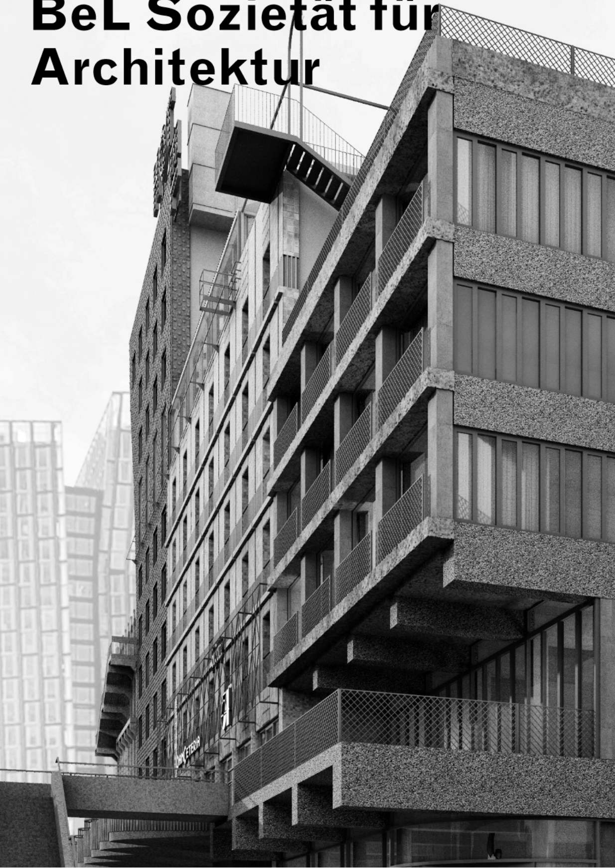
BeL Sozietät für Architektur, Spielbudenplatz, Sankt Pauli, Hamburg, from/ vanaf 2016