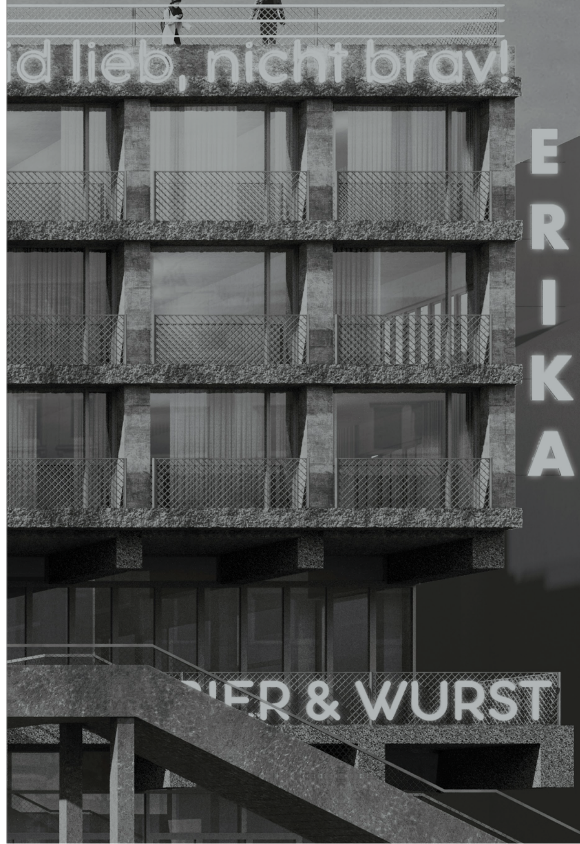
BeL Sozietät für Architektur, Spielbudenplatz, Sankt Pauli, Hamburg, from/ vanaf 2016