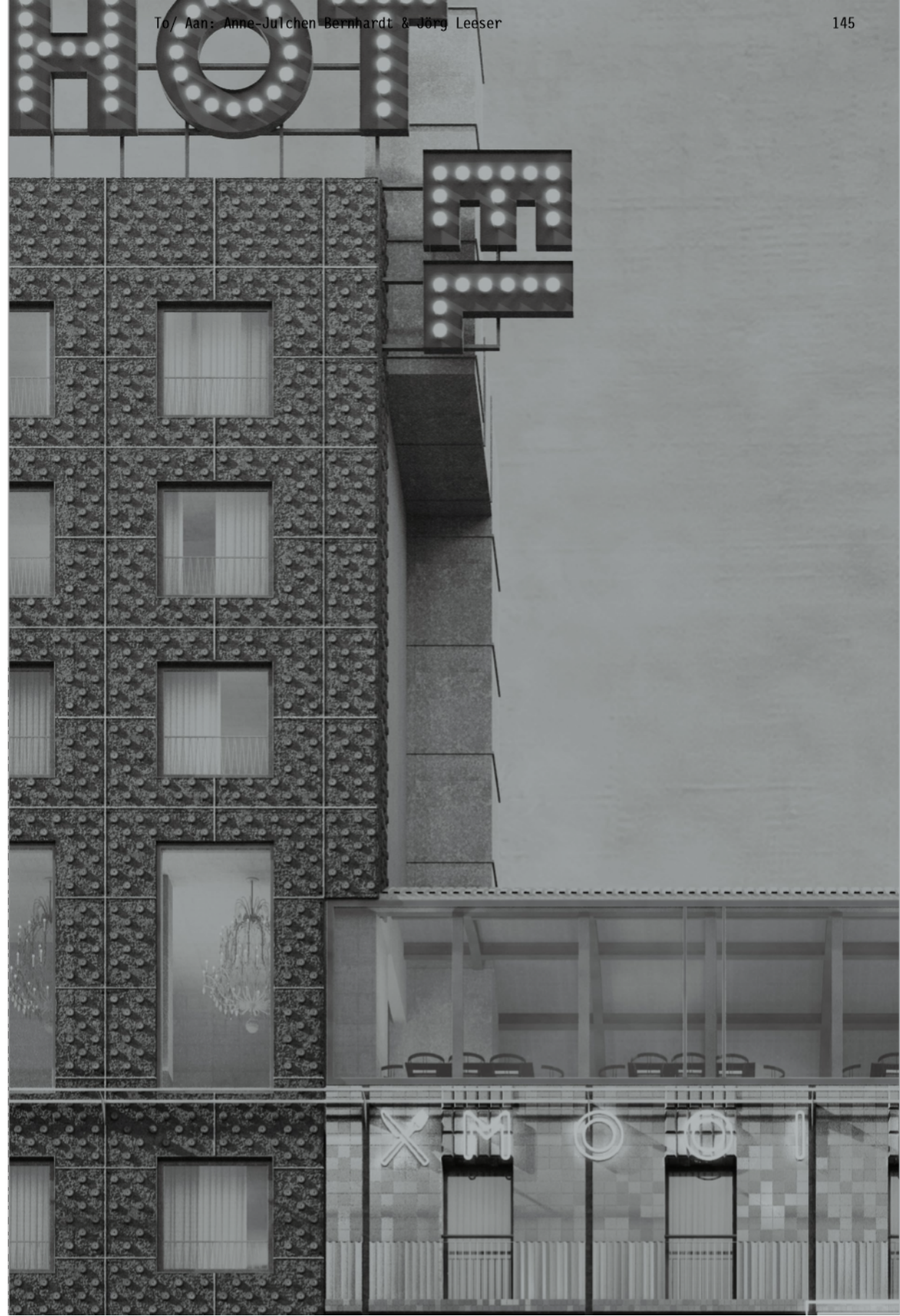
BeL Sozietät für Architektur, Spielbudenplatz, Sankt Pauli, Hamburg, from/ vanaf 2016